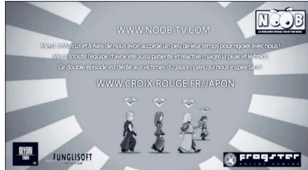
Figure 4. Saison 03 épisode 01, générique de fin.

Pour qui veut étudier ce type d'objet, découle de ce constat la nécessité de se doter d'un appareil lui-même hybride, permettant de saisir cette spécificité. L'importance du caractère performatif de l'objet et l'indéniable action de la « réception » invitent logiquement à adopter une perspective pragmatique. Grâce à l'examen détaillé d'un cas d'étude (plus précisément d'un élément particulier; un commentaire déposé en ligne à propos d'un épisode de la web-série), cette contribution élabore une démarche théorique et méthodologique à partir du croisement d'ensembles préexistants, individuellement non conçus pour l'examen de ce type d'objet : une sociologie compréhensive comme cadre général et surtout l'articulation étroite entre le modèle sémio-pragmatique de Roger Odin et la théorie du signe de Charles S. Peirce. Une fois élaborée, cette hybridation théorique sera elle-même croisée avec la démarche empirique, donnant naissance à une nouvelle hybridation, les deux modèles n'étant pas originellement issus, ni à destination directement, d'un fonctionnement en situation, « sur le terrain ». Enfin, cela permettra de mettre le produit de ces multiples hybridations à l'épreuve afin d'en éprouver la validité et d'avancer des conclusions concernant notre objet d'étude, la web-série Noob , qui tiennent pleinement compte de ses spécificités.