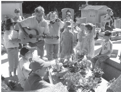
Photographie 5. Les enfants du groupe vocal Les Copains d'accord's venus déposer quelques « fleurs musicales » sur la tombe de G. Brassens à l'occasion de la Fête de la musique.

Cette offrande qui est faite à Georges Brassens, ou plutôt ce contre-don en chansons, n'est pas sans évoquer d'autres formes de clin d'œil faites par d'autres pèlerins à d'autres chanteurs. Ainsi, sur la tombe de Serge Gainsbourg, enterré au cimetière de Montparnasse à Paris, des tickets de métro sont-ils fréquemment déposés en guise d'offrandes symboliques faites au Poinçonneur des Lilas . Ces tickets sont glissés sous des petits cailloux qui, dans la tradition juive, sont utilisés comme marque de visite et qui permettent ici de rappeler l'appartenance de Serge Gainsbourg à cette communauté. Parfois, ce sont même des choux-fleurs qui sont offerts à L'homme à tête de chou . Près de Québec, au pied de la sépulture de Félix Leclerc, enterré au cimetière de Saint-Pierre de l'île d'Orléans, ce sont des dizaines de vieilles chaussures qui sont déposées régulièrement par les pèlerins et ainsi offertes au chanteur de Moi, mes souliers .