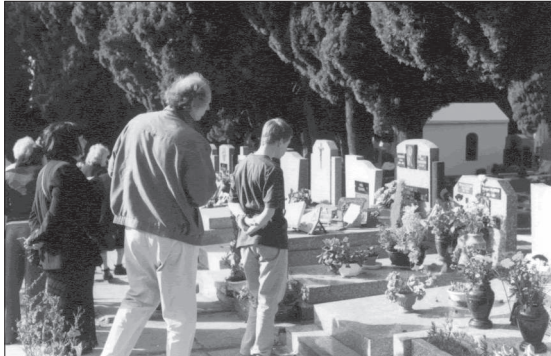
Photographies 7 et 8. Pèlerins au cimetière Le Py.

Venus très souvent en famille (ou avec un accompagnateur de groupes touristiques en été), le plus souvent à l'occasion d'un séjour dans la région, beaucoup se demandent à voix haute qui sont les personnes enterrées aux côtés du chanteur, chacun émettant ses propres hypothèses. Peu importe la banalité des mots échangés, ce qui compte et ce que ces pèlerins semblent avoir bien compris, c'est que parler des morts, les dire, c'est les faire exister, encore être.