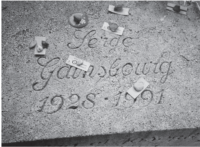
Photographie 6. Les tickets de métro posés par des pèlerins sur la tombe de S. Gainsbourg au cimetière Montparnasse à Paris.

Mais en dehors de ces faits occasionnels, les pratiques des pèlerins sur la tombe de Georges Brassens n'ont rien de démonstratif ni d'irrationnel. Celles-ci relèvent plutôt de pratiques ordinaires et d'attitudes attendues dans un cimetière. Le plus souvent, les pèlerins ne passent que quelques minutes sur la tombe du chanteur alors qu'ils ont parfois parcouru de nombreux kilomètres (nous avons rencontré plusieurs pèlerins venus de Belgique ou de Suisse). Si quelques-uns d'entre eux s'éloignent en larmes, les attitudes les plus fréquemment observées consistent à faire un signe de croix, à filmer ou à photographier la sépulture. Ce film ou ces photographies ne seront d'ailleurs pas nécessairement regardés ou affichés une fois rentrés chez eux ; ce qui compte c'est plutôt « la belle photo » qu'ils garderont dans leur tête.