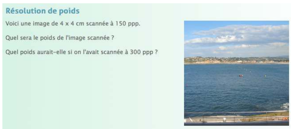
Figure : exercice - Produire et retravailler une image, Chapitre 2