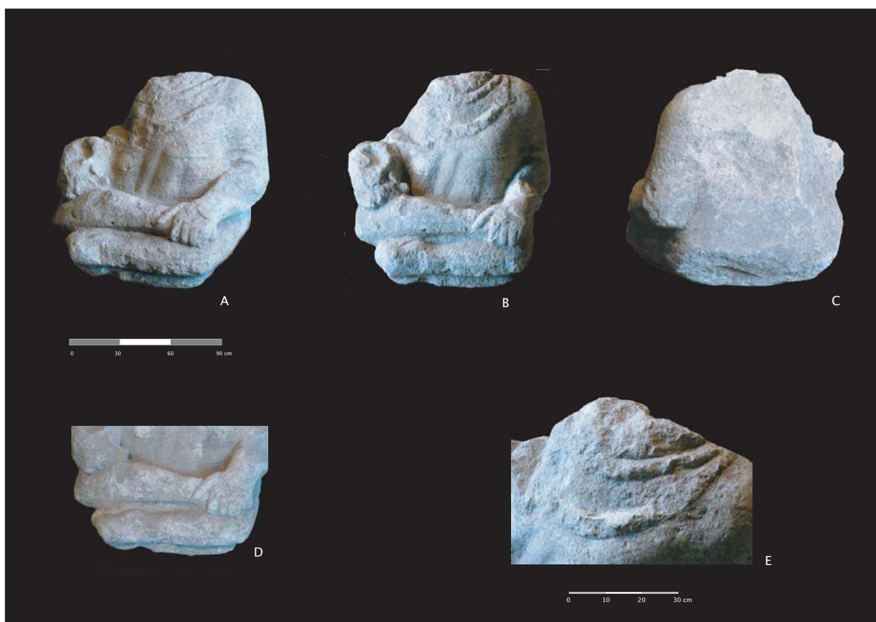
Fig. 2 : La statue de Meillant vue sur ses différentes faces.

disproportion entre le corps et les jambes. Celles-ci ne sont pas dans une configuration anatomique naturelle, leur position semble contrainte afin de pouvoir être insérées dans un cadre prédéfini. Il s'agit soit d'une maladresse, soit d'un choix délibéré du sculpteur qui a pu se référer à un modèle dans lequel les jambes n'avaient qu'une fonction symbolique. D'ailleurs, elles sont particulièrement petites, tout comme les pieds qui s'apparentent à ceux d'un enfant ou d'un bébé (Fig. 2, D). Ce mode de représentation évoque notamment la statue de bronze de Bouray (Megaw, Megaw 2001 : pl. XVIII, p. 156), qui montre les mêmes caractéristiques : disproportion évidente de la partie inférieure du corps et position contrainte des jambes (Fig. 3, n° 1). Dans les deux cas, les pieds sont petits et nus et les jambes repliées l'une sur l'autre, gauche sur droite à Bouray, droite sur gauche à Meillant (Fig. 2, B). La main gauche, la seule visible et conservée, montre cinq doigts, quatre jointifs et pouce détaché. Cette main enserme la partie supérieure du pied droit, comme