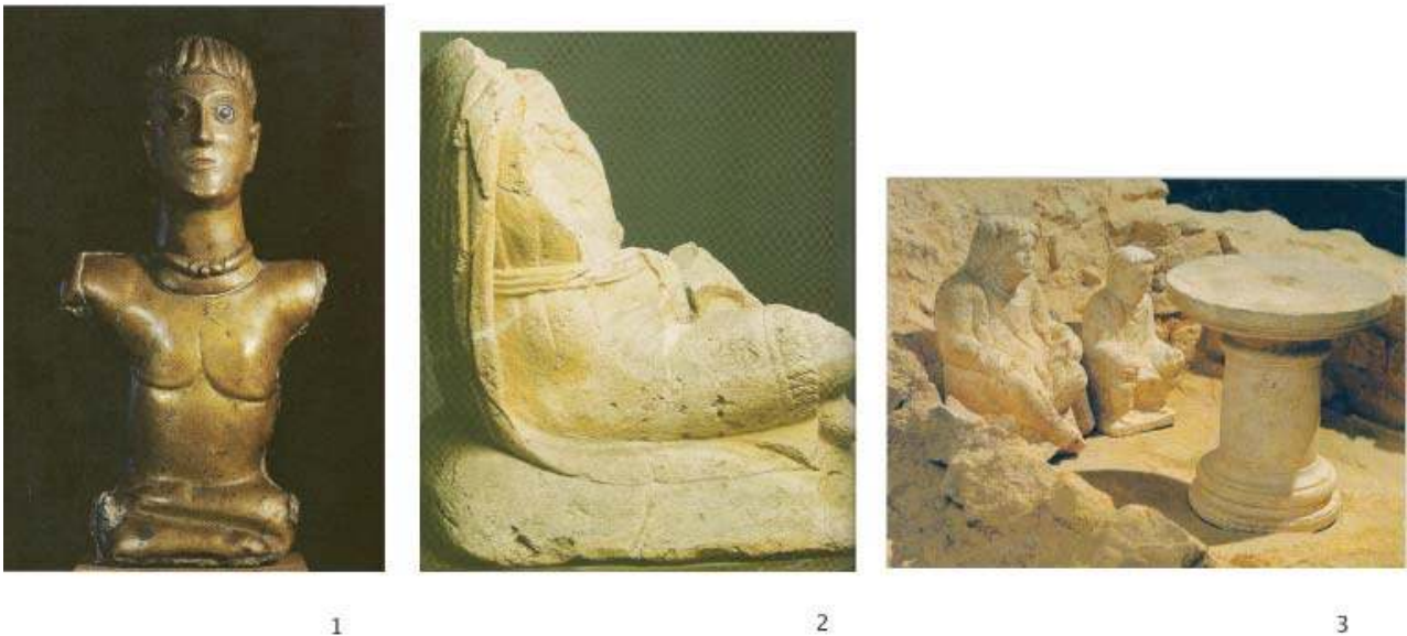
Fig. 3 : Comparaisons.

Les découvertes archéologiques ont été peu nombreuses sur le territoire de la commune de Meillant (Provost et al. 1992). Un tumulus protohistorique est signalé au Bois de Coury. Pour la période gallo-romaine, on recueillit fortuitement en 1783, dans les vignes des Pandures, deux coffres funéraires hauts chacun d'un mètre ainsi que quelques monnaies (Martinet 1878). À la fin du XIX e s., on mentionne également dans la commune, sans autre précision, des "vestiges d'habitations romaines". Quant à la voie antique de Bourges à Clermont par Drevant et Nérès-les-Bains, elle passait à quelque 5 km à l'ouest du bourg. À Saint-Rhomble enfin, fut trouvé un fragment de sarcophage contenant une agrafe à double crochet en bronze, un ardillon de ceinture en bronze et des mailles de bracelet (VII e -X e s.).