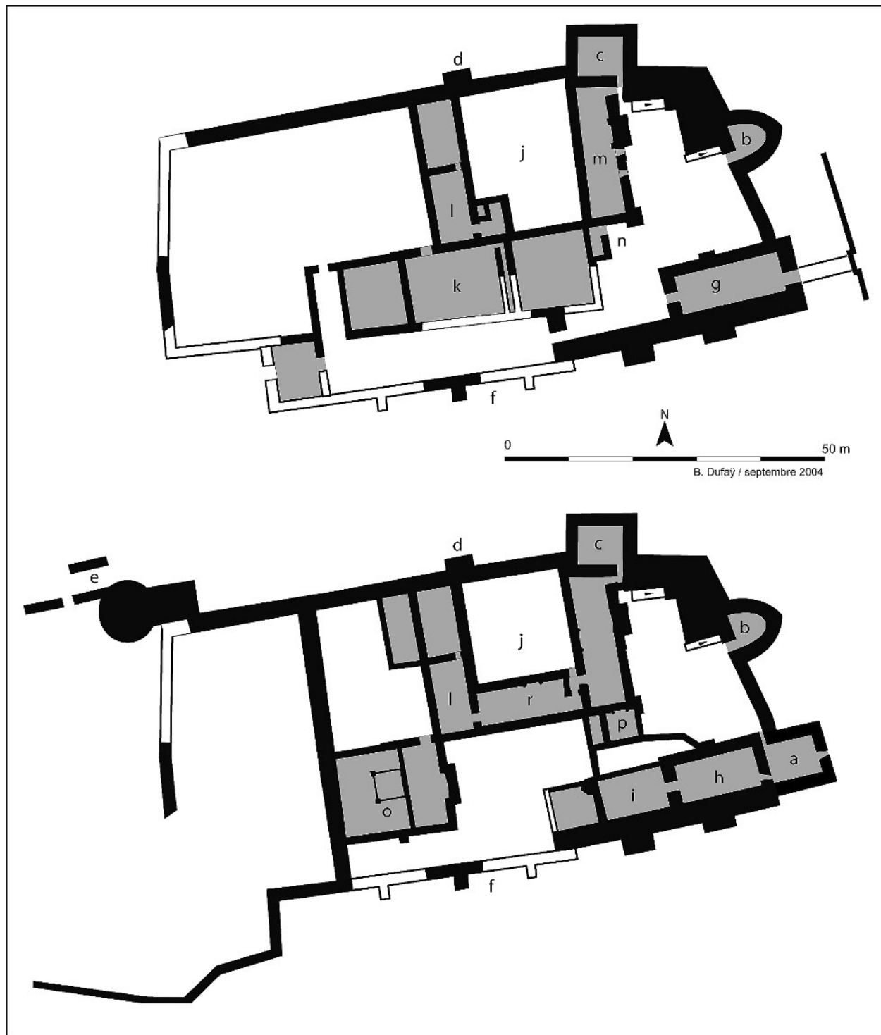
Fig. 2 : Présentation des deux principales phases du fort. En haut, l'organisation du site dans la seconde moitié du XII e s. ; en bas, au XIV e s.