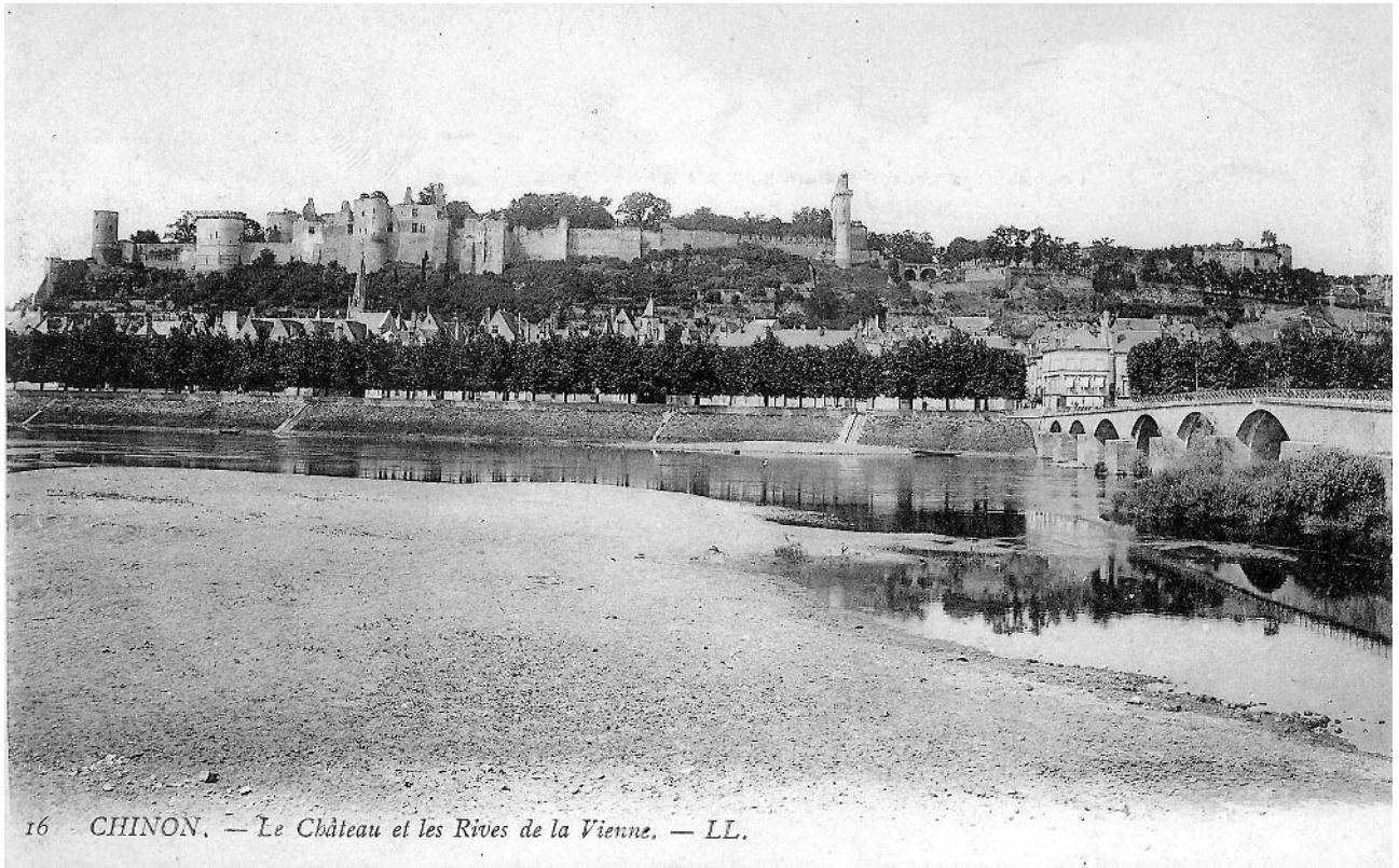
Fig. 1 : Carte postale (début du XX e s.) représentant l'ensemble de la forteresse de Chinon. À droite on distingue l'extrémité orientale du fort Saint-Georges, et en particulier la tour carrée attenante à la chapelle, effondrée en 1906.