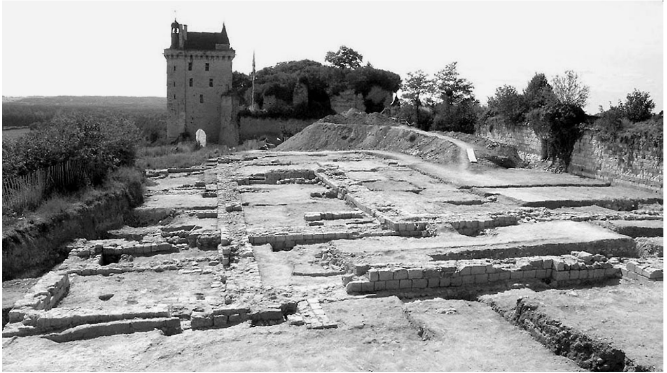
Fig. 3 : Vue, depuis l'est, de l'ensemble des vestiges mis au jour lors des campagnes de 2003 et 2004.

Pour récupérer une partie de la place perdue par la destruction de l'aile sud et conserver la disposition autour d'une cour, une nouvelle aile sud fut construite, plus au nord, empiétant dans l'ancien espace de la cour dont toutes les façades furent refaites à ce moment (Fig. 2r). Cette salle reçut une cheminée; plus tard, elle vint s'articuler sur l'aile orientale par un sas aménagé dans l'angle.