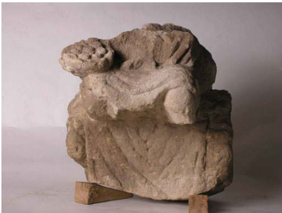
Fig. 2 : Face antérieure de la sculpture de Brioude. Larg. max. 24,0 cm ; H. max. 25,8 cm ; Ép. : 21,7 cm