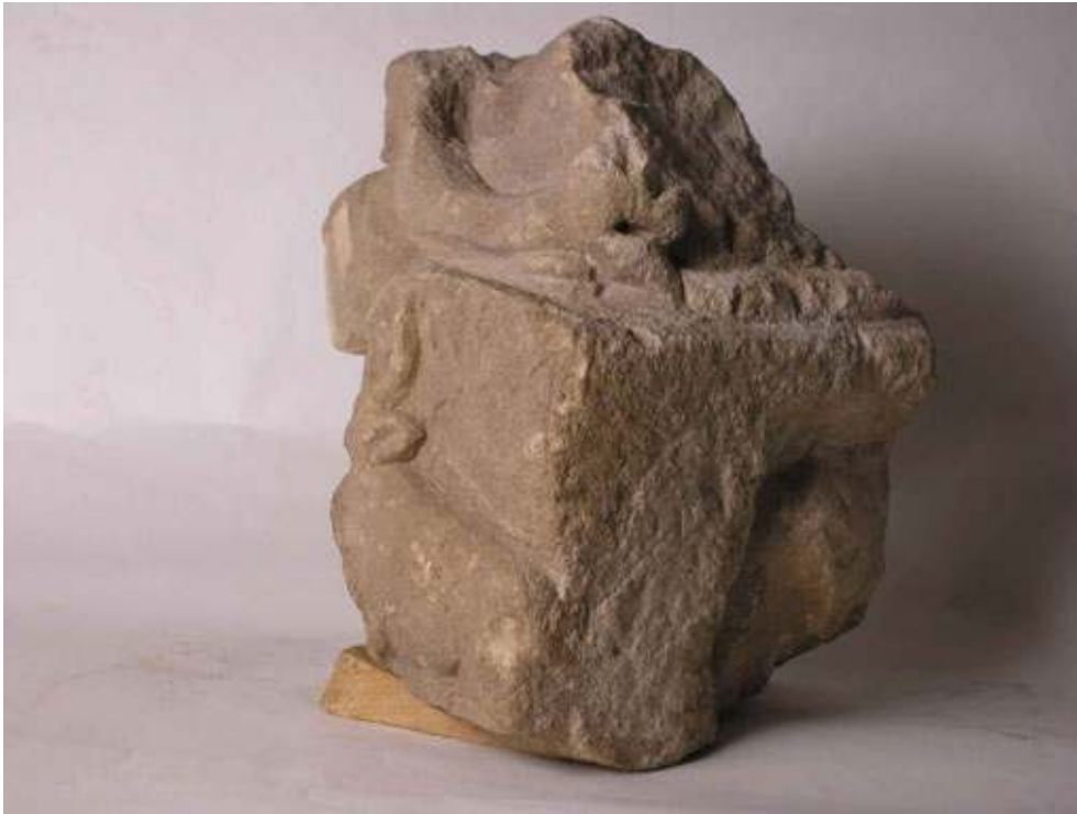
Fig. 4 : Face postérieure du fragment