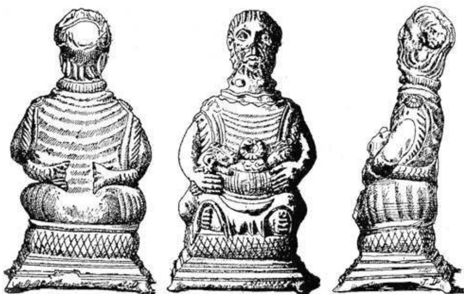
Fig. 7 : Statuette en Bronze de Savigny. H : 10,7 cm, MAN, del Deyts 1992