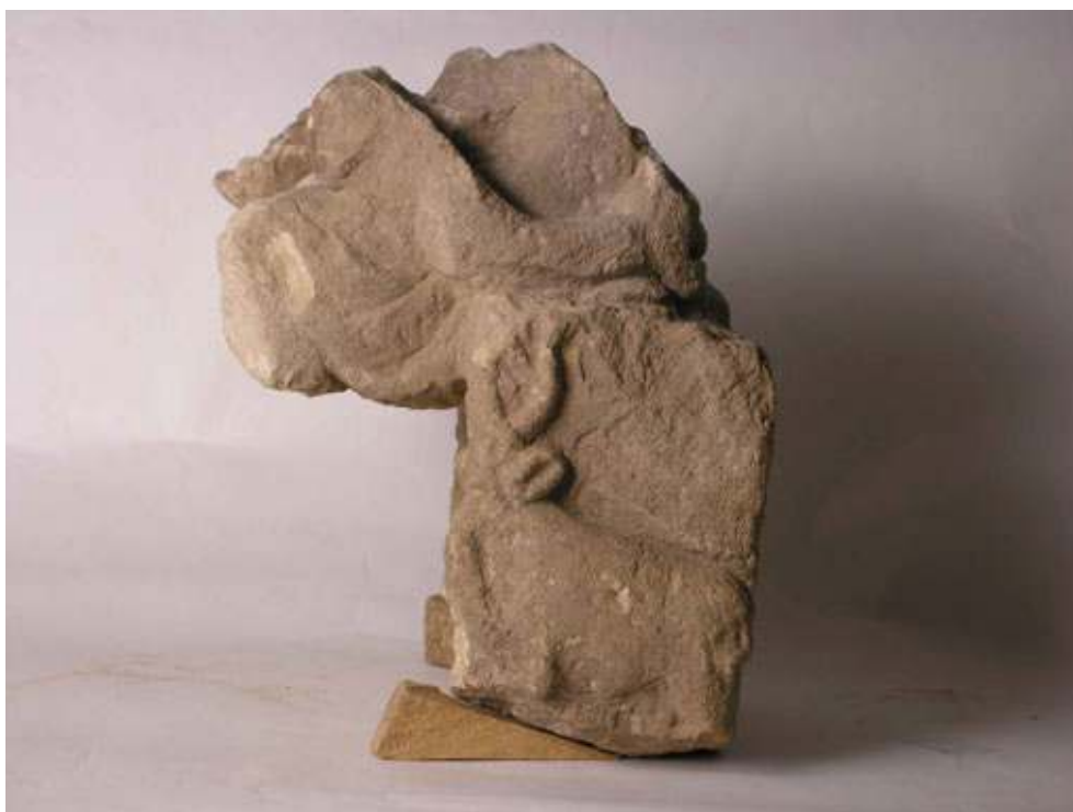
Fig. 3 : Côté droit du fragment