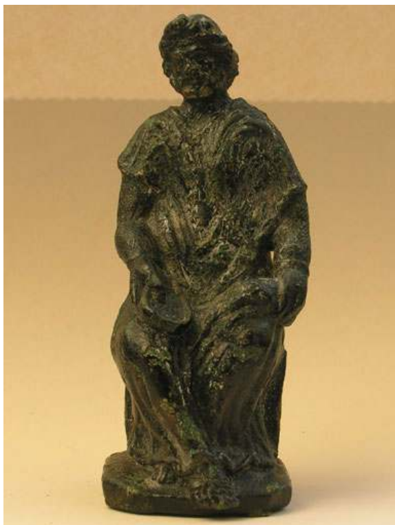
Fig. 6 : Statuette de Cernunnos de l'Hôtel de la Région à Clermont-Ferrand. H. 8,8 cm

enroulés autour de la taille d'une autre statuette en bronze représentant le même dieu, découverte à Savigny (Fig. 7, Deyts 1992 : 44-45).