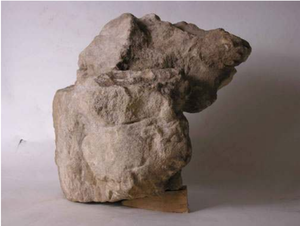
Fig. 5 : Détail du Taureau