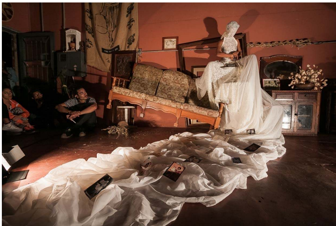
Imagem 2 – Performance Leite Derramado .