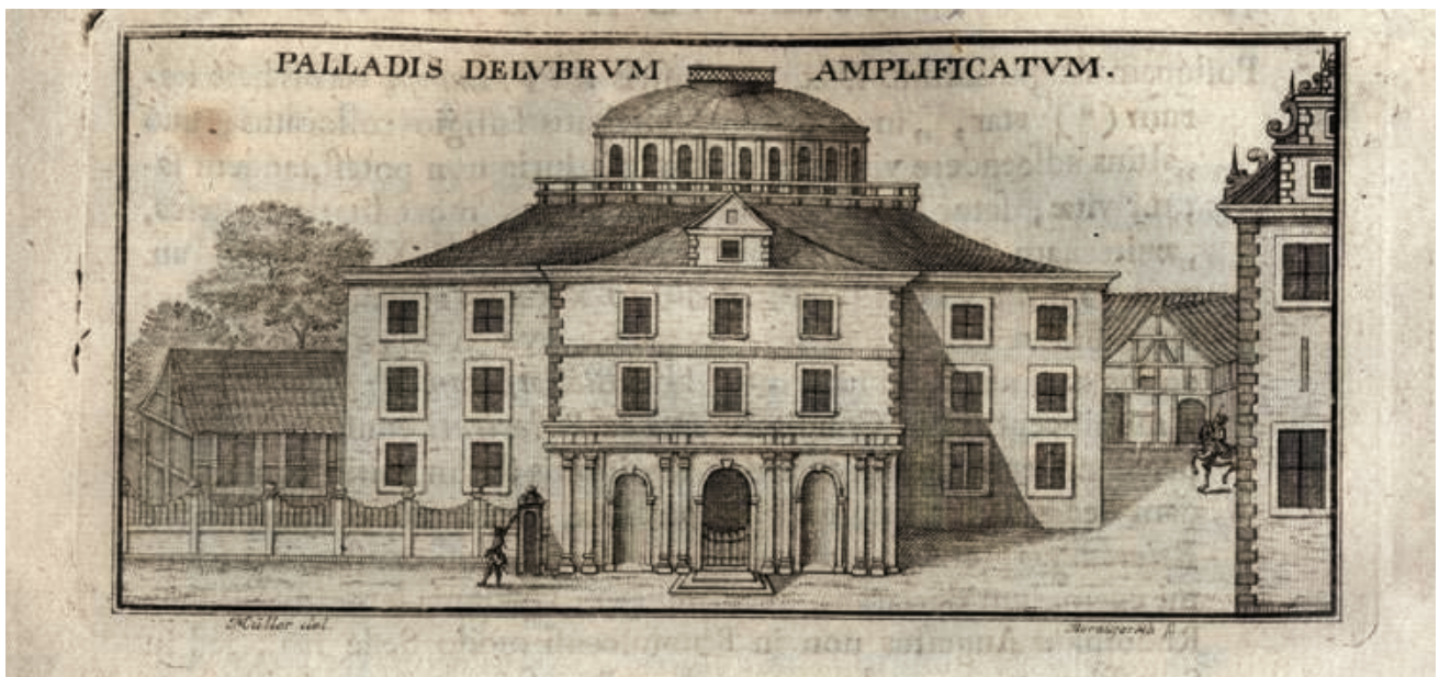
La « rotonde » a été construite de 1706 à 1710 ; c'est l'un des premiers bâtiments, au nord des Alpes, spécifiquement construits pour abriter une bibliothèque (in Jacob Burckhard, Historia bibliothecae Augustae [pars 1], Wolfenbüttel, s. d.)

Le trésor de connaissances, constitué par la convergence des informations provenant du pays tout entier, devait ensuite être à nouveau diffusé à travers ce même pays afin que le progrès gagnât tous les niveaux du savoir.