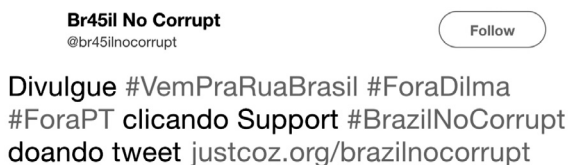
FIGURA 1 – Imagem do tuíte enviado pela conta @br45ilnocorrupt

A centralidade das contas em redes de retuítes pode ser impactada pelo uso de ferramentas de automatização. De fato, a elevada média diária de publicação de tuítes de algumas das contas, como @br45ilnocorrupt, @Lobaoeletrico e @Andres_Cano42 na rede pró- impeachment e @turquim5 e @MarivoneProf na rede anti- impeachment , sugere que estes recursos tenham sido utilizados, mas não temos dados que permitam determinar o seu impacto (ver Tabelas 1 e 2). Outra evidência de automatização é o uso, pela conta @br45ilnocorrupt, do serviço de “doação” de tuítes Justcoz , como ilustra a Figura 1 de uma mensagem da conta: