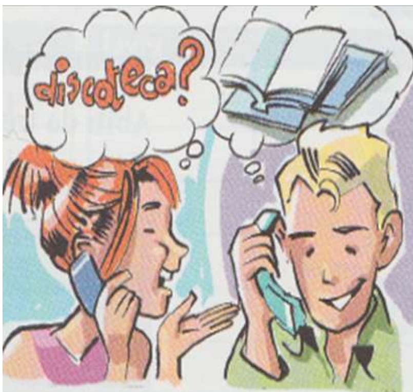
Image 7 – « temps libre et loisirs II » (Bozzone Costa et al., 2007 : 51)