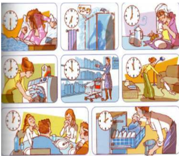
Image 1 – « Observez ces vignettes et racontez la matinée type de Madame Durand » (Léonard, 2011 : 57)