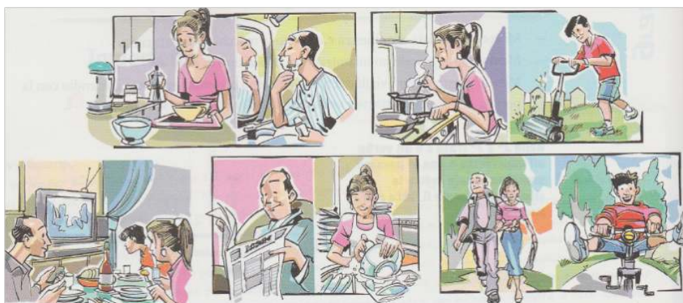
Image 3 – « Le dimanche de la famille Togni » (Bozzone Costa et al. , 2007 : 162)