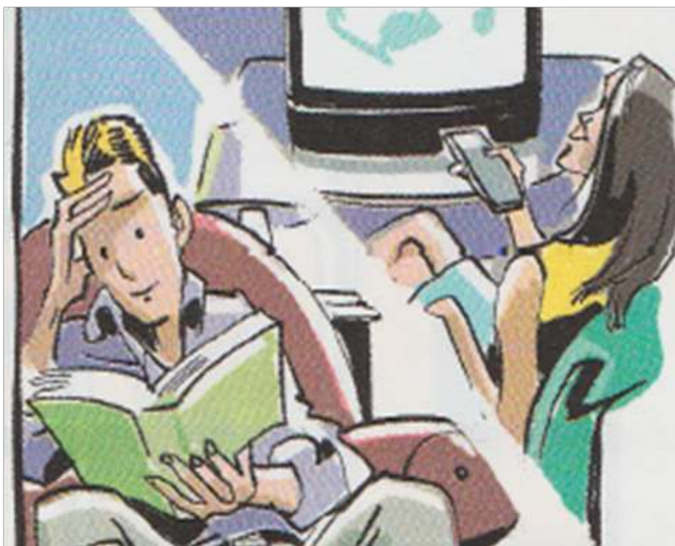
Image 6 – « temps libre et loisirs I » (Bozzone Costa et al. , 2007 : 47)