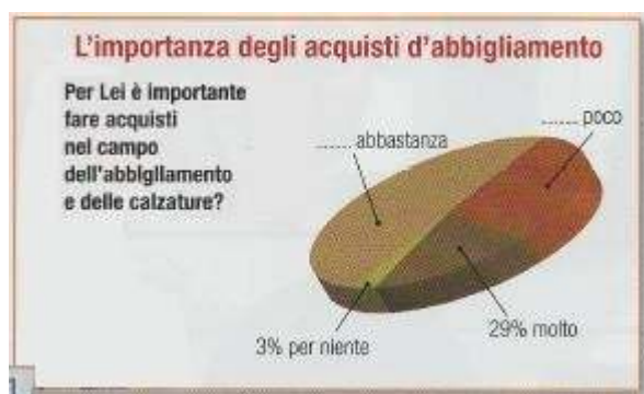
Image 5 – « L'importance des achats des vêtements et des chaussures pour les Italiens » (Bettinelli et al. , Buona idea ! , Pearson Italia, 2011 : 117)