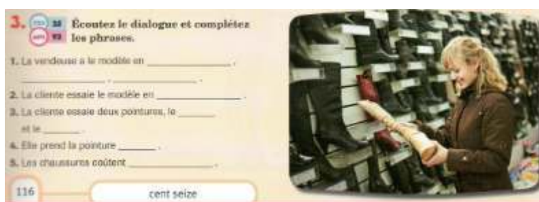
Image 2 – « Écoutez le dialogue et complétez les phrases » (Léonard, 2011 : 116)