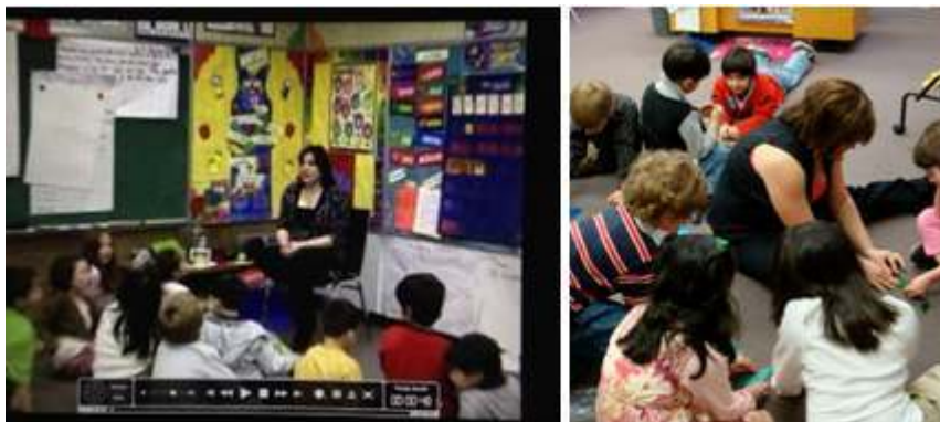
Figure 1 – Postures : Deuxième et Troisième séances