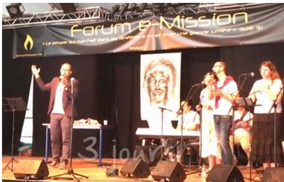
Figure 6 : image du premier forum Lights in the dark (louange), Canza Nova tirée de la vidéo « Mgr Rey vous invite au forum e-Mission ! » 39