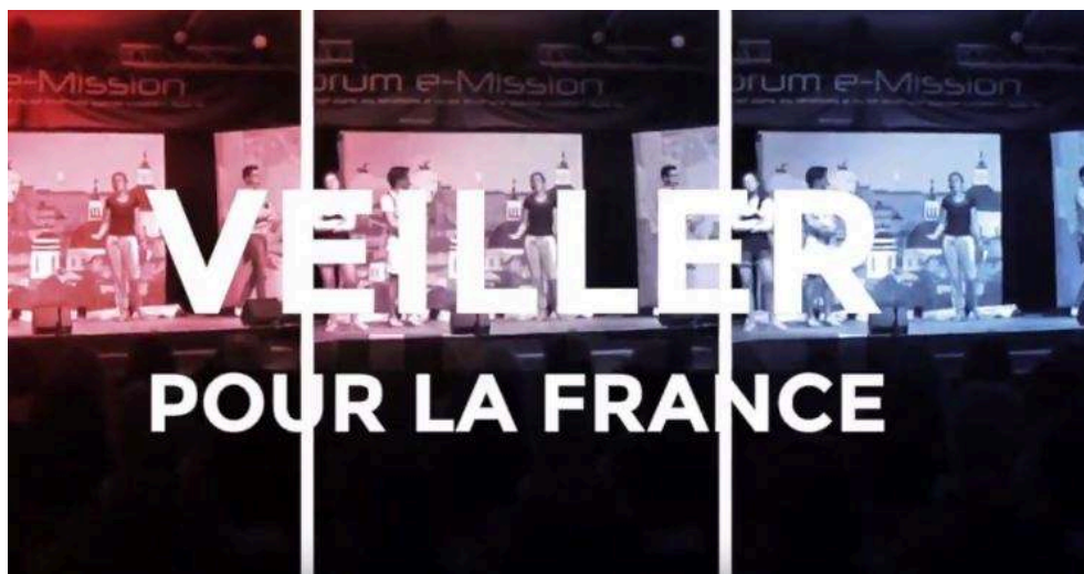
Figure 7 : vidéo d'annonce du deuxième forum Lights in the dark « "Prendre son envol" (teaser Forum e-Mission #2) » (23.01.18) 47

aux « crimes » commis par l'avortement, lors du second. Le chant s'engage alors dans un combat social et politique chrétien.