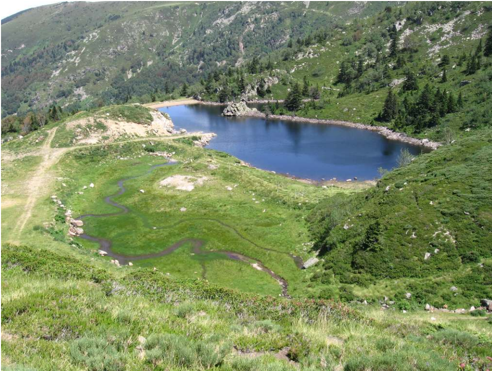
Figure 5 – Retenue partiellement construite sur une zone humide