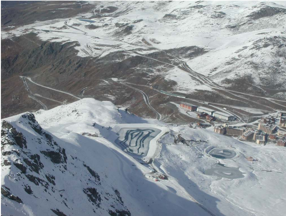
Figure 4 – Retenue d'altitude surplombant des enjeux