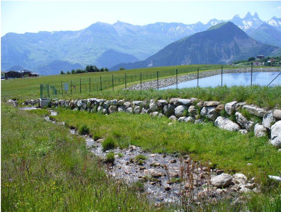
Figure 3 – Retenue soumise à un risque torrentiel avéré