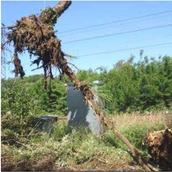
Figure 1. Grosse racine traçante, très longue, de saule blanc en pied de berge

peupliers et les saules arborescents ont également la particularité d'émettre de gros pivots lorsqu'ils peuvent capter l'eau en profondeur, ce qui génère des risques d'effondrement localisés après pourrissement de la souche. Ces essences (peuplier, robinier et saule) sont hélas très répandues sur les ouvrages. L'introduction de ces espèces doit donc à tout prix être évitée sur les digues neuves ou reconstruites.