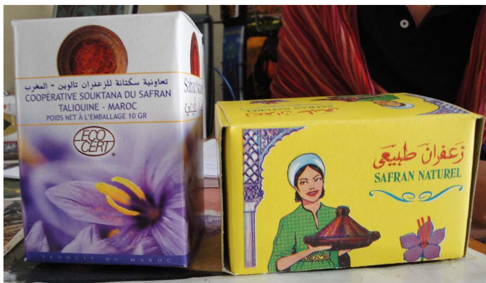
AVRIL 2010