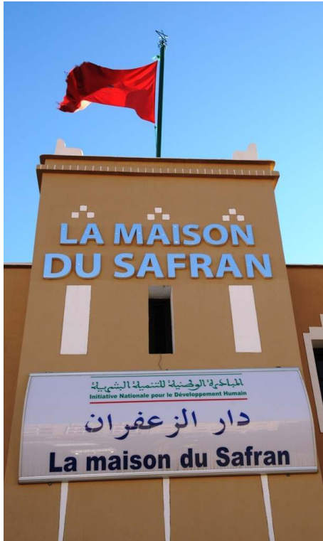
Figure 3. La Maison du safran, Taliouine

CLICHÉ D. MASELLI, JANVIER 2012, PUBLIÉ AVEC SON AUTORISATION