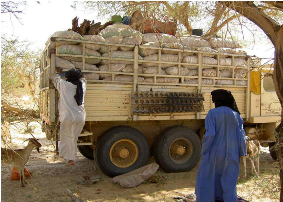
Figure 7. Écoulement des sacs d'oignons dans l'Aïr