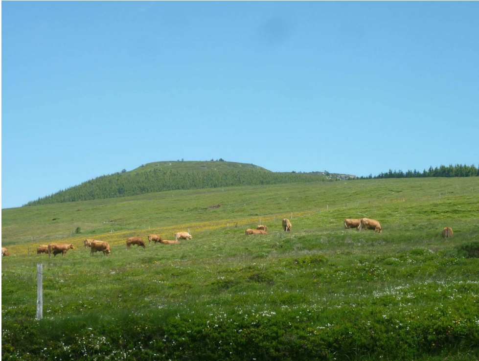
Photo 1. Pâturage des bovins sur les hautes terres du Mézenc