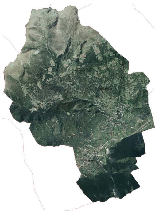
Fig. 1. Roncegno Terme