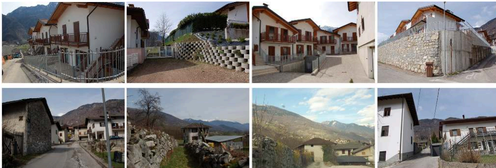
Fig. 4 Marter. Costruzioni più recenti (sopra) e costruzioni più tradizionali (sotto)