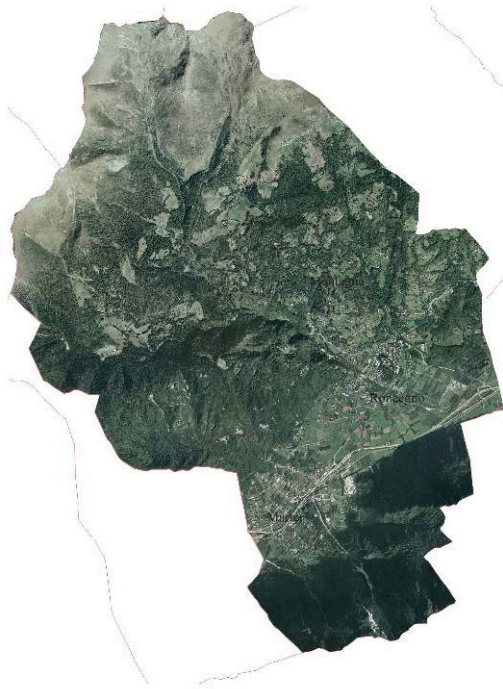
Fig. 1. Roncegno Terme