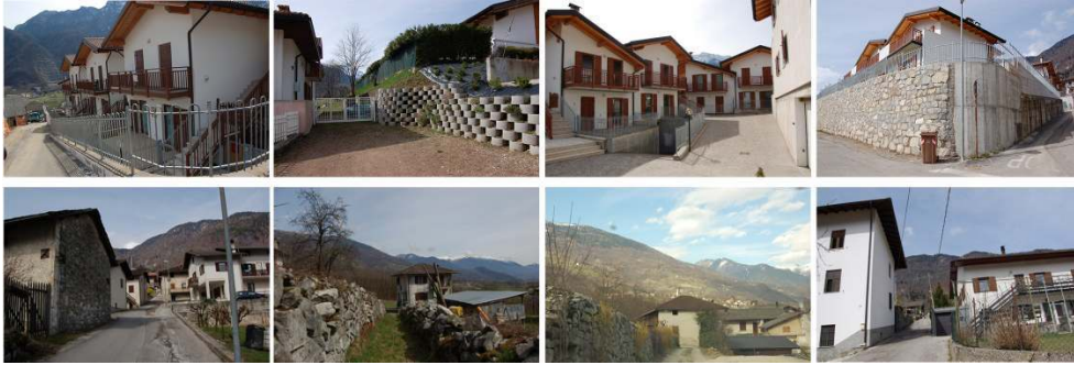
Fig. 4 Marter. Costruzioni più recenti (sopra) e costruzioni più tradizionali (sotto)