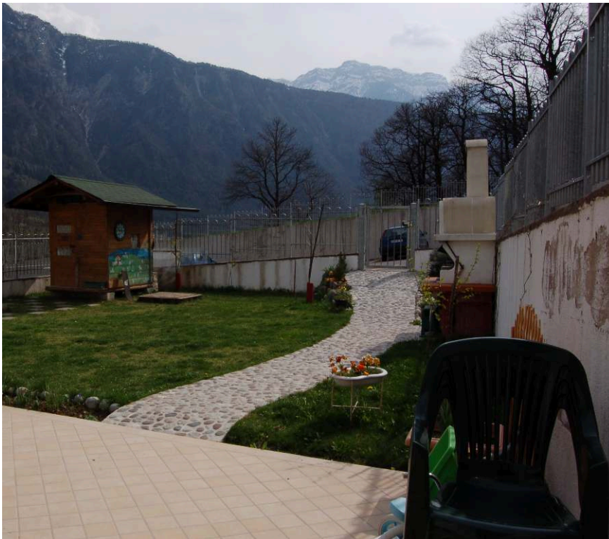
Fig. 5. Marter, casa con giardino