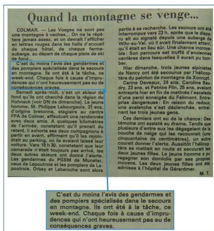
Figure 7 : Mise en avant de l'imprudence des victimes d'avalanche. DNA , 3 mars 1986.