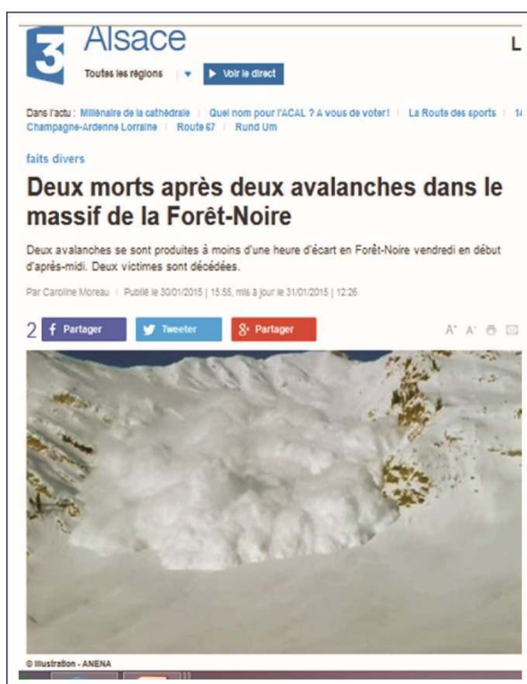
Figure 5 : Article en ligne de France 3 Alsace associant une photographie d'une avalanche en aérosol prise dans un cadre typiquement alpin à un article portant sur deux accidents en Forêt-Noire, 31 janvier 2015

les médias participeraient par là-même à minimiser les phénomènes du Massif vosgien. Et ce, d'autant plus lorsque la terminologie employée pour désigner les phénomènes avalancheux va jusqu'à rendre leur identification problématique. Ainsi, à la suite d'un accident survenu en 2007, la présentatrice du journal télévisé régional parle de « rupture du manteau neigeux » 49 . Pour sa part, L'Alsace du 31 janvier 2010 titre : « Ballon d'Alsace : un randonneur à raquettes dévale sur une plaque de neige », sous-entendant qu'il n'a été victime que d'une simple glissade ! Le phénomène ne pourrait, en effet, « être saisi en pensée, c'est-à-dire signifié, que lorsqu'il est (dé)nommé » (Noyer et Raoul, 2011b). Le vocabulaire employé joue, plus largement, un rôle important. Depuis les années 1970, les médias régionaux emploient deux terminologies, avalanches et coulées de neige, et ce dans un même article, sans qu'aucune logique d'utilisation n'apparaisse clairement mis à part pour les phénomènes touchant les axes routiers du Massif vosgien, toujours qualifiés de « coulées de neige » 50 . Or, l'usage de l'un ou l'autre terme ne serait pas neutre puisque celui de « coulée » tendrait à minimiser le phénomène (Ancey, 1998 ; Burnet, 2004).