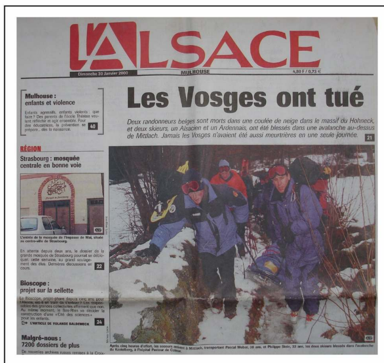
Figure 4 : Une de L'Alsace , 30 janvier 2000, « les Vosges ont tué ».