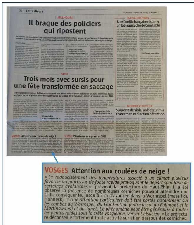
Figure 3 : « Alerte aux coulées de neige » dans la page « faits divers » de L'Alsace du 29 janvier 2016.