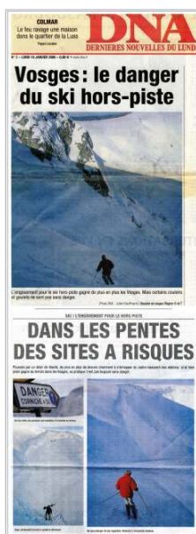
Figure 6 : Ambivalence du discours médiatique : illustrations accompagnant la mise en garde contre les pratiques hors-piste dans le Massif vosgien. Une et extrait du dossier, DNA , édition du 16 janvier 2006.