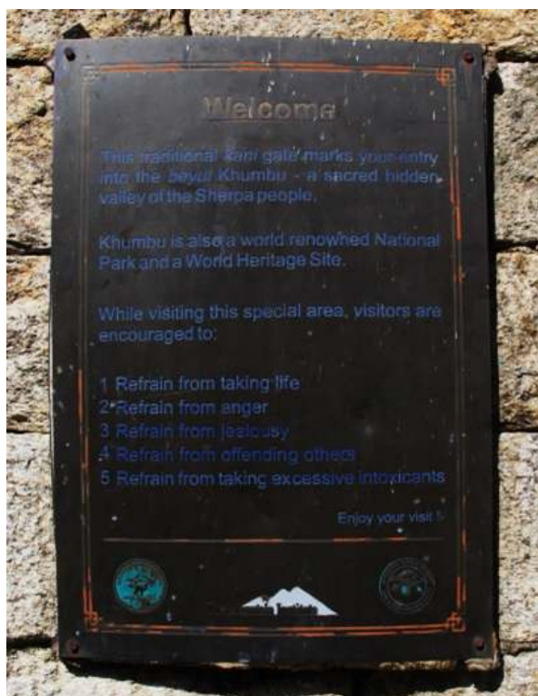
Figure 3– Entrée du Parc National de Sagarmatha

Pénétrant au sein du beyul , le visiteur est invité à respecter plusieurs règles s'inscrivant dans une vision édénique de la région.