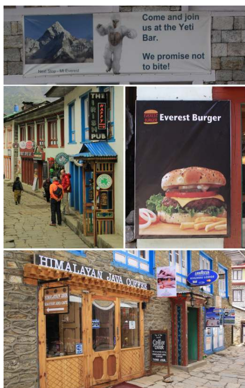
Figure 4 – Devantures de cafés dans les villages de Lukla, Phakding et Namche Bazaar