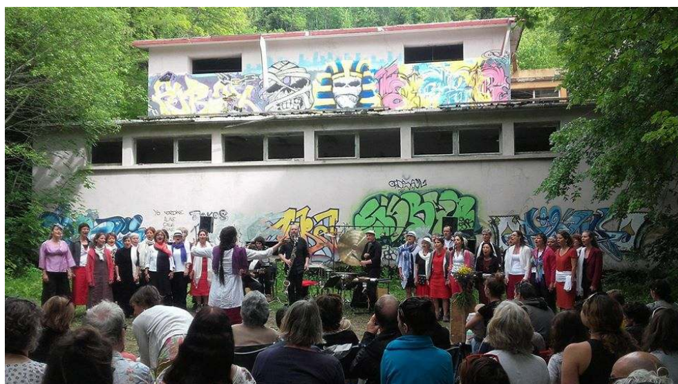
J. Gauchon, 2018