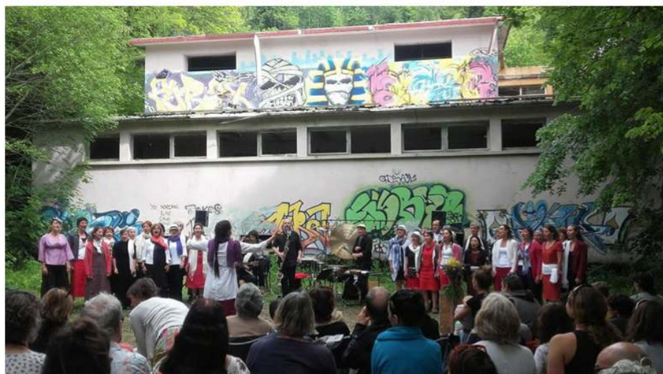
Photo 4 : La sortie de résidence des musiciens du projet « Les Sanas », le 10 juin 2018