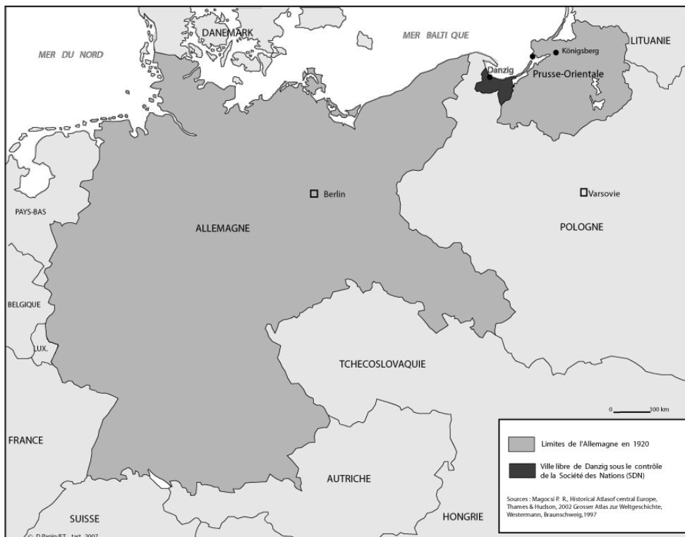
Carte 2 : La Prusse-Orientale, séparée de l'Allemagne par le Traité de Versailles.