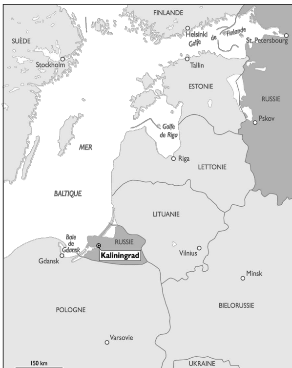
Carte 1 : Kaliningrad, une enclave russe sur la Baltique.