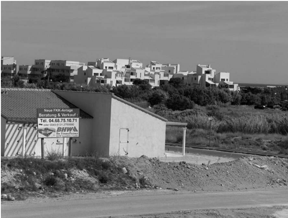
Photo 3 : Panneau de promotion immobilière en allemand pour un nouveau lotissement naturiste à Port-Leucate (Aude). Juin 2006.