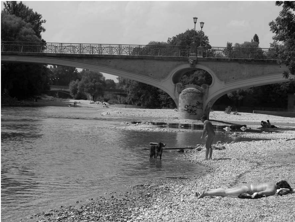
Photo 1 : Les bords de l'Isar en plein centre de Munich. On notera la cohabitation de nudistes et de « textiles ». Juillet 2006