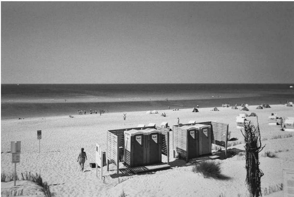
Photo 2 : La plage nudiste officielle (F.K.K.) de List, au nord de l'île de Sylt (Schleswig-Holstein). Août 2004.