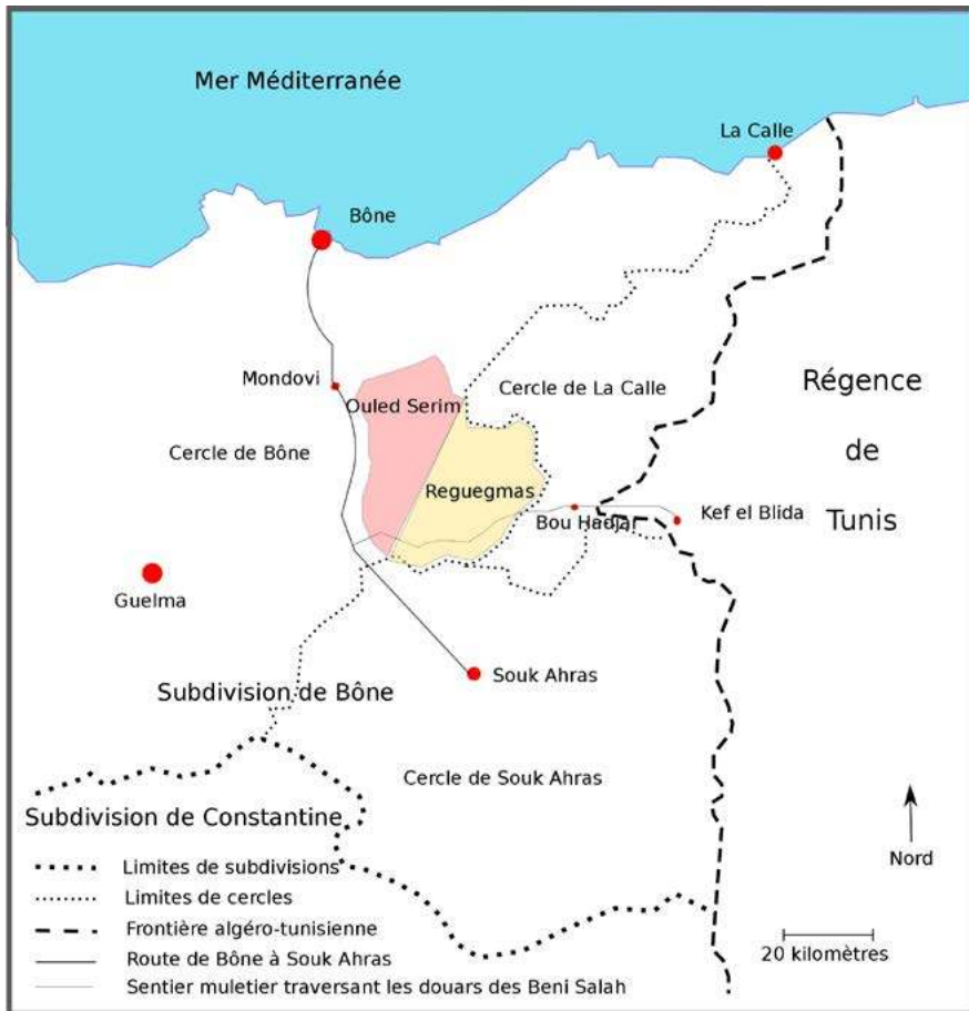
Carte des Beni Salah répartis sur les douars des Ouled Serim et Reguegmas en 1863. Réalisée à partir de la carte du territoire militaire restant à la subdivision de Bône et de la carte à l'appui de la nouvelle organisation de la subdivision de Bône, ANOM, 10H13.

objet nécessite des emprunts à différents courants historiographiques. Ainsi l'histoire des représentations du banditisme est un préalable indispensable à l'appréhension des données émergeant des sources 14 . La variété des sources disponibles permet de faire une histoire sociale à condition d'adopter une focale locale 15 . L'approche micro-historienne est ainsi également convoquée pour traiter ce sujet.