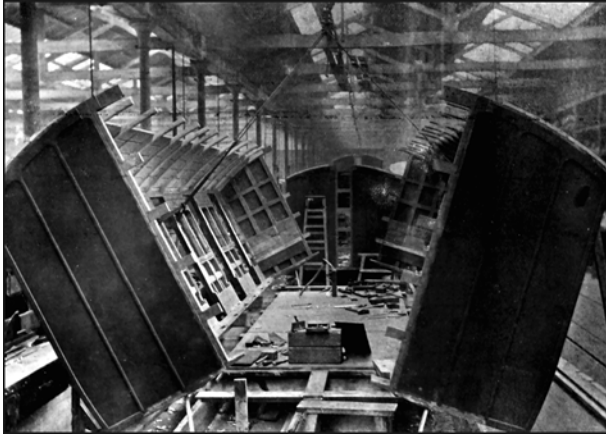
Figure 4. Le « sciage en long » de voitures anglaises, en 1902, dans les ateliers du Great Eastern Railway , sans doute un des documents les plus « surréalistes » de l'histoire technique des chemins de fer : le gabarit de la voiture passera de 7 pieds 7 inches à 8 pieds 6 inches , soit un gain d'un pied (30 cm), permettant d'accroître la capacité d'un train de 636 à 768 voyageurs.

alignement – sauf le Midi qui comptait 1 445 mm. Les faces internes des roues, en revanche, ont des cotes qui varient d'un réseau français à l'autre.