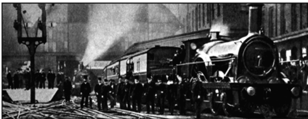
Figure 3. Le dernier train en voie large à Paddington en 1892 : noter la complexité des appareils de voie.