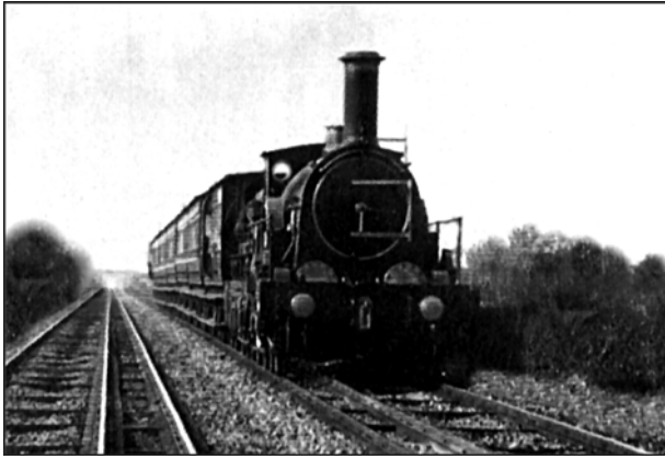
Figure 2. Vue d'un train en voie large de Brunel vers 1890. Le gabarit du matériel n'est guère plus large que l'écartement de la voie et n'offre donc pas plus de possibilité de transport que le matériel à voie normale. Noter le troisième rail préparant la conversion qui sera achevée en 1892.

20 mai 1892, le dernier train de voyageurs à voie large quitte la gare londonienne de Paddington, le fameux Cornishman de 10 h 15, et le tout dernier train, toutes catégories confondues, est le train postal de nuit reliant Penzance à Londres arrivant tôt le matin du 21 mai 1892 (fig. 3).