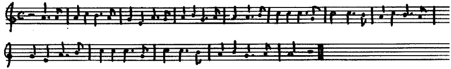
Illustration 4. – La complainte de Fualdes.