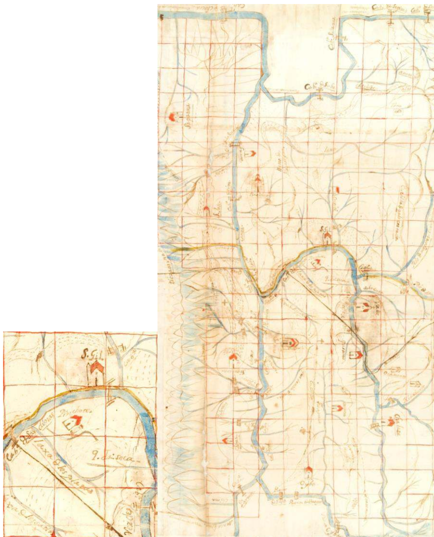
Mapa 1. Villas de San Gil y Socorro, con detalle de Pinchote, 1776