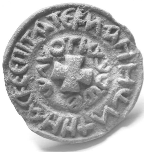
Fig. 2: Marqueur de pain, British Museum n. inv. 1995 11-7 10.

utilisés pour permettre l'enregistrement du pain offert à l'église, même s'ils servaient aussi pour la cuisson du pain de table dans des fours collectifs 31 . Les pains d'eulogie étaient offerts dans l'attente d'une bénédiction divine comme on le voit par les inscriptions de certains marqueurs. Un marqueur conservé au British Museum à Londres porte la formule de prière «Eulogie du Seigneur sur nous et sur nos enfants» pour appeler la bénédiction sur une famille. On peut imaginer qu'il était utilisé chaque semaine pour le pain de la prosphora (fig. 2).