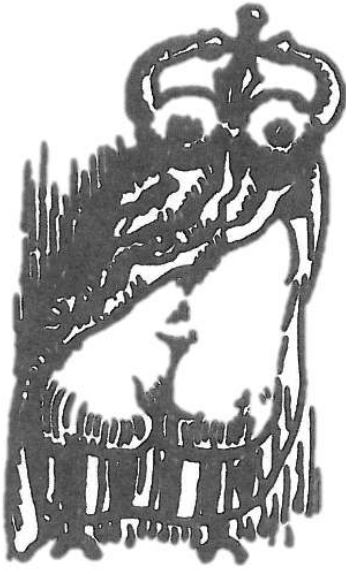
Fig. 2. André Masson, « Mériidienne », lithographie, dans Michel Leiris, Glossaire j'y serre mes gloses (1939).