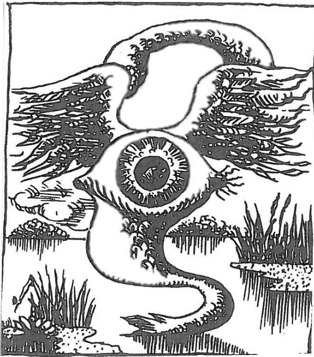
Fig. 5. André Masson, « Signe », lithographie, dans Michel Leiris, Glossaire j'y serre mes gloses (1939).