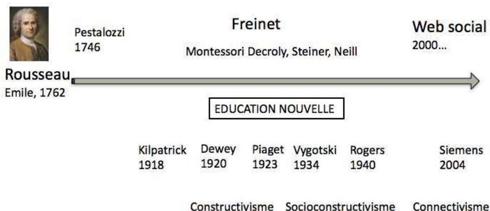
Figure 1. De Rousseau au Web social