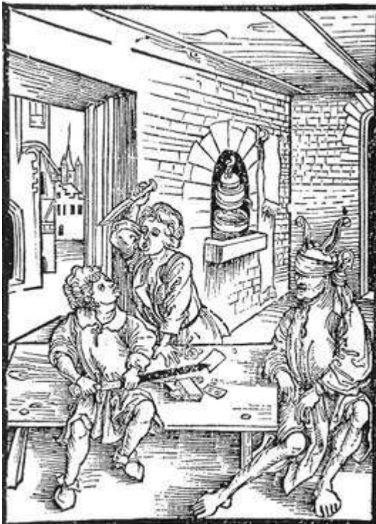
Sébastien Brant, La Nef des fous (1494) : De l'éducation des enfants 55