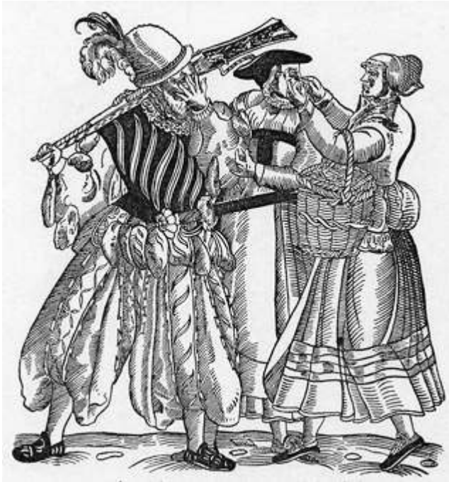
Wolfgang Strauch (s.d.) : La femme jalouse du lansquenet 58

la main aux doigts entrouverts en disant dans le texte accompagnant la gravure : « pourquoi vous maltraitez-vous, je vous laisse faire et regarde entre les doigts » :