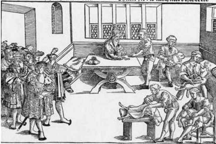
Anonyme (ca.1530), L'avertissement du Pape à ses valets du Temple 77