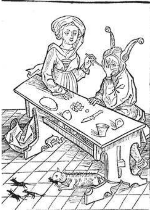
Sébastien Brant, La Nef des fous (1494) : De l'adultère 56

correspondant apparaissent, toujours chez Sébastien Brant, lorsqu'il traite d'un sujet classique des sermons de moralité médiévaux, de l'adultère. Si on « regardait entre les doigts » et laissait son épouse à un autre homme, ce serait agir comme le chat qui fait risette aux souris – c'est-à-dire adapter une conduite contre-nature. Sur la gravure, le mari est vêtu de l'habit du fou, comme ci-dessus le père et comme les autres protagonistes qui équipent la nef des fous.