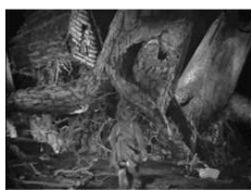
L'isba de Baba Yaga

influencés par le cinéma expressionniste allemand (et surtout par les décors du Cabinet du docteur Caligari , sorti en 1920), les univers qu'il représentent ne pourraient pas être plus différents. Le monde de la Yaga est celui de la forêt noire, confuse et menaçante, mais profondément organique et donc humaine. Celui du Zmeï, en revanche, est un monde industrialisé, géométrique, et aseptisé. Un monde, en quelque sorte post-humain ou dépourvu d'humanité. Un monde fasciste. En effet, le contexte historique dans lequel Vassilissa fut produit invite à une lecture allégorique. Le pacte germano-soviétique a été signé le 23 août 1939 et le film est sorti le 13 mai 1940, un an avant l'invasion nazie de l'URSS le 22 juin 1941. À l'époque, donc, l'Allemagne n'était pas encore un pays ennemi et il est difficile d'imaginer que le choix de conte de Ro'ou était politiquement motivé. Le film ne laisse néanmoins planer aucun doute sur l'atmosphère tendue de l'époque. Baba Yaga rôde perpétuellement autour de Vassilissa, telle la Mort autour de la Jeune Fille dans les tableaux occidentaux. Ce n'est pas simplement la virginité de la Russie – l'intégrité de ses frontières – qui est menacée, c'est sa vie.