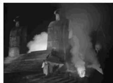
Et dans le monde du Zmeï Gorynytch