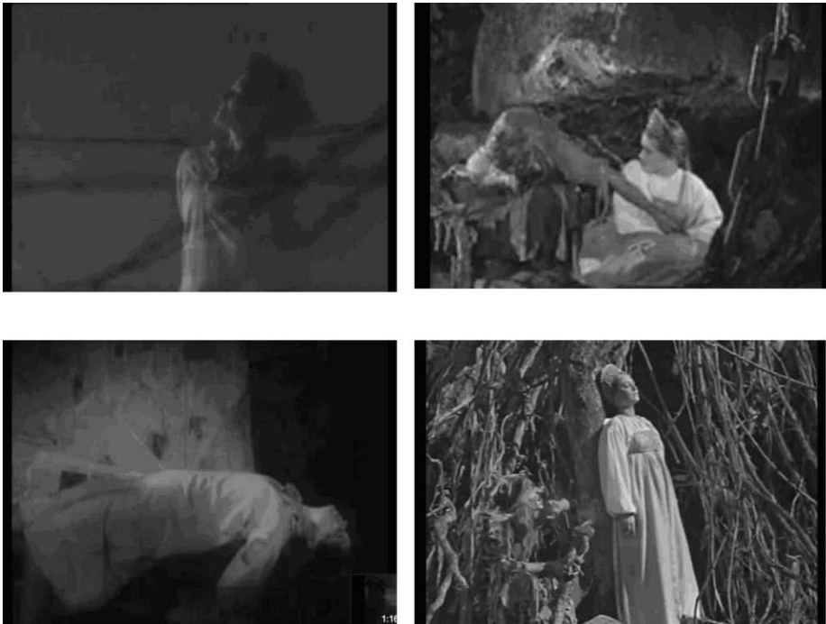
Vues par derrière des chaînes, du fil barbelé ou dans la position de victime sacrificielle, Zoïa Kosmodemianskaïa (à gauche) et Vassilissa (à droite) deviennent des modèles de résistance.