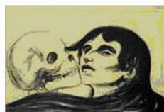
La Jeune Fille et la Mort d'Edvard Munch