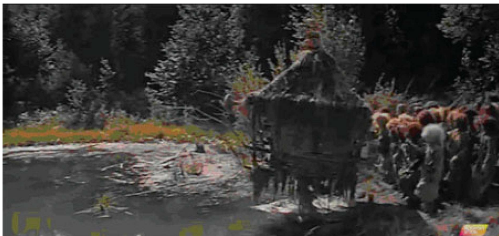
Les enfants-lechii chassent Baba Yaga, cloîtrée dans son isba, dans le marais à la fin de Cornes d'or (1972).