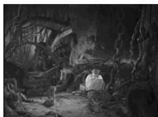
Vassilissa dans le monde de Baba Yaga...