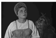
Baba Yaga et Vassilissa