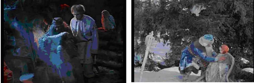
Baba Yaga et Morozko habillent les protagonistes en vêtements chauds.