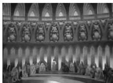
Intérieurs du palais de Zmeï Gorynytch