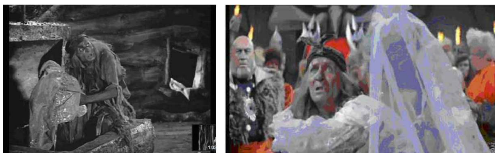
Entremetteuse d'antan, Baba Yaga sera obligée de reprendre la fiancée au lieu d'en procurer une dans Par feu et par flammes (1968).