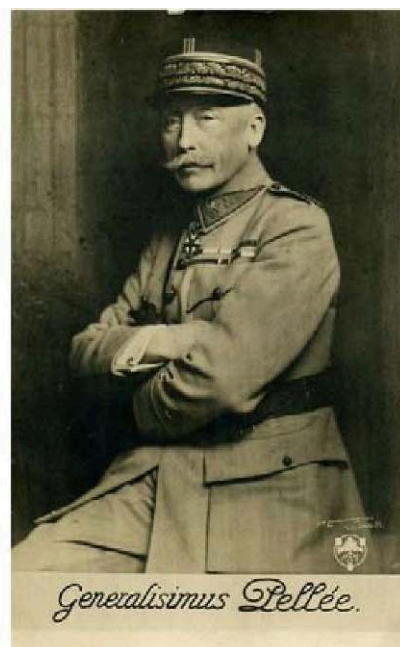
Deux portraits du général Pellé : à gauche, à la une du magazine «Le Pays de France » du 1 er mars 1917 ; à droite, photo officielle en tchécoslovaquie.