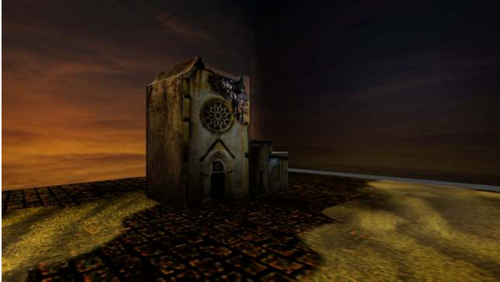
Application Alter Ego , Bâtiment des Trinitaires, Image 3D Donia Benharara, IUT de Saint-Dié