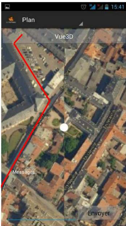
Application Alter Ego , parcours d'une étape