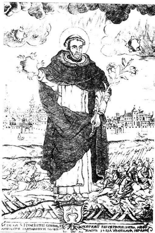
Fig. 3 – Tomas Stekel, gravure pour l'ouvrage de Dominique Frydrychowicz, S. Hyacinthus Odrovasius Principalis Hierarchicus Universalis Regni Poloniae Patronus [...] , Cracovie, 1688.