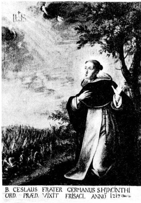
Fig. 5 - B. CESLAUS FRATER GERMANUS [...], tableau peint pour l'église claustrale des dominicains de Friesach en Carinthie, 1717.