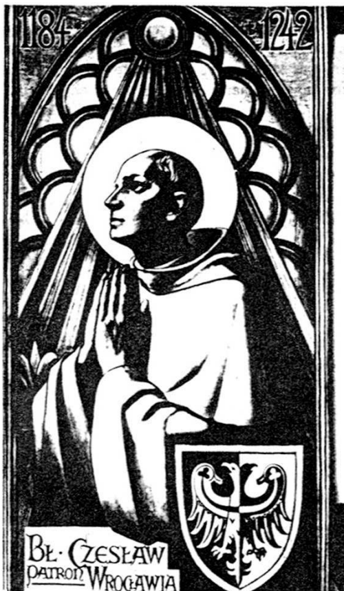
Fig. 6 – Le Bienheureux Ceslas, patron de la ville de Wrocław, représentation datant du deuxième quart du XX ème siècle.