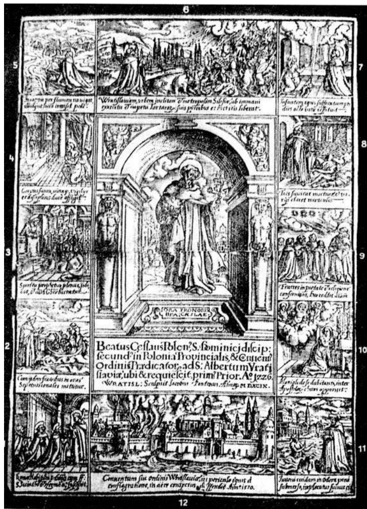
Fig. 1 – Jacob Pontanus, Ora pro nobis. Beatus Ceslaus Polon[us] [...] , gravure sur cuivre, 1599.