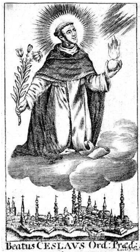
Fig. 4 – Sans titre, gravure datant du tournant des XVII ème et XVIII ème siècles, actuellement conservée dans les collections de la Bibliothèque universitaire de Wrocław.