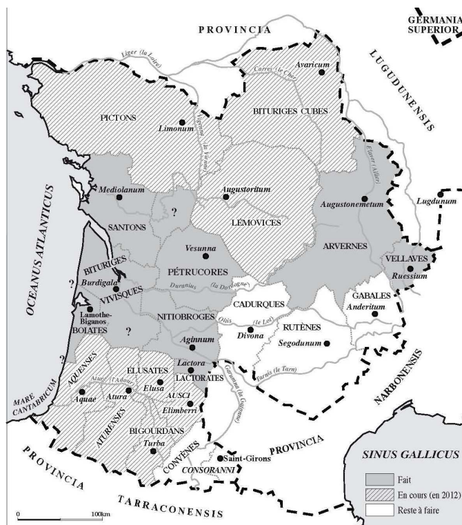
Fig. 1. État d'avancement de la publication des ILA en 2012