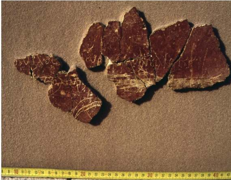
Fig. 3. Graffito de la "Maison des Nones de mars"