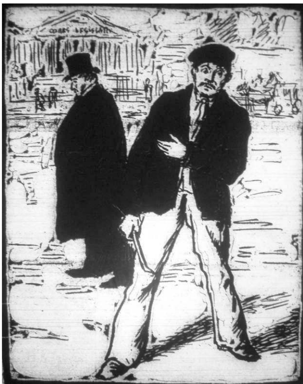
Le Père Peinard , 11 décembre 1892 ; coll. particulière. Mazas est une prison. L'éditorial du numéro du 25 décembre suivant est violent : les panamistes « aux réverbères ! »

« Qué bidards, ces filous de Panama ! Voilà ce que c'est que de voler en grand... Y a pas de pet qu'on les foute à Mazas. »