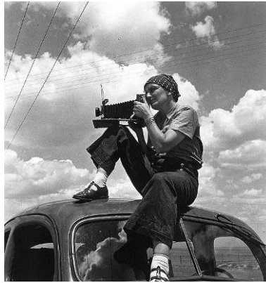
Fig. 2. Anonyme, Dorothea Lange, 1936.

intention longuement préparée est, la plupart du temps, beaucoup plus près de l'iconicité que du symbole, ce que suggère l'image donnée ci-contre de Dorothea Lange installée nonchalamment sur le toit de son véhicule, caméra à la main. De ce point de vue, la photographie de Florence Owens Thompson est une icône au même titre que la fillette fuyant son village terré dans des rizières au Viet-Nam, soumis au tir de napalm des avions de chasse. Ou encore ce garçonnet juif photographié dans le ghetto de Varsovie, coiffé d'une casquette trop grande pour lui et revêtu d'une culotte courte montrant de petites jambes fragiles et qui lève les deux mains, prêt à s'embarquer naïvement dans le train qui le conduira, on sait où... Ou encore cette image qui a marqué l'imaginaire du dernier tiers du xx e siècle, celle du Che Guevarra, réduite à quelques taches d'encre suggérant la tête d'un homme barbu, portant fièrement un bérêt muni d'une étoile.