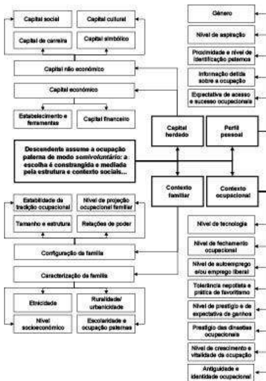
Figura 2 Síntese da interpretação sociológica do autorrecrutamento ocupacional.