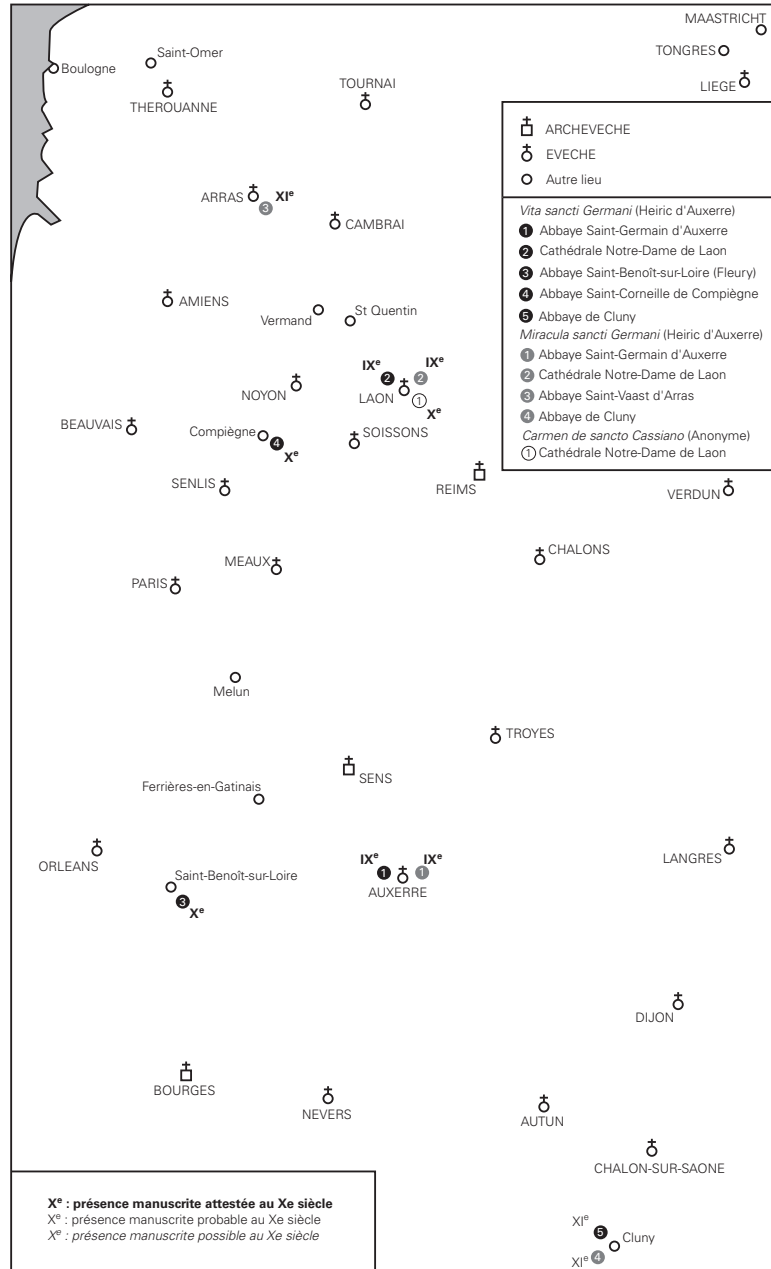
Carte 2: répartition des manuscrits renfermant la Vita sancti Germani d'Heiric d'Auxerre et le Carmen de sancto Cassiano à l'époque de Dudon de Saint-Quentin.