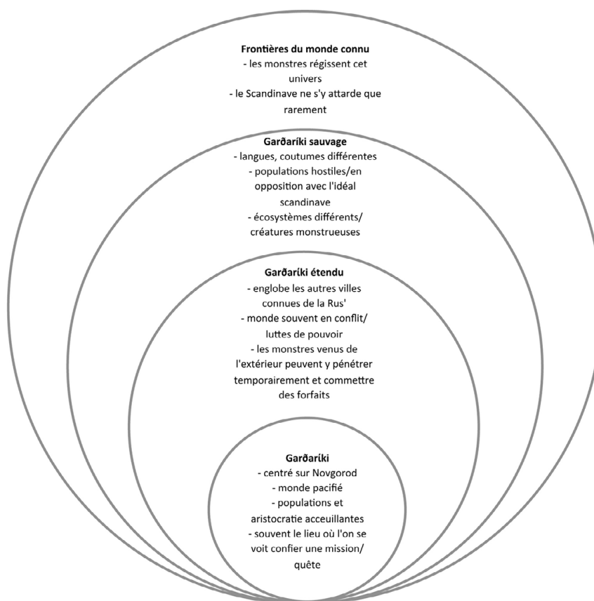
Figure 1 – L'organisation de l'espace russe dans les fornaldarsögur

maladie parmi l'équipage scandinave 29 . La troisième zone est pour sa part peuplée à la fois de communautés humaines et de créatures qui sont hostiles aux héros, et s'en prennent souvent directement à eux. Il peut s'agir comme dans l' Yngvars saga víðförla de géants ou de cyclopes, ou encore de bandits, qui sur des bateaux camouflés en formes de petites îles, attaquent l'équipage à l'aide d'une sorte de tuyau d'airain faisant office de lance-flammes, évoquant en quelque sorte le feu grégeois byzantin 30 . Cet épisode n'est donc pas sans rappeler que de nombreux pillards sévissaient sur ces voies de transit. Mais outre ces groupes de bandits, c'est plutôt la réaction des communautés sédentaires qui interpelle, chaque interaction débouchant sur des affrontements nés souvent d'incompréhensions. Alors qu'il faisait commerce avec les populations locales, Sveinn, fils d'Yngvarr « le grand voyageur », vit un Girskr, c'est-à-dire un habitant venant du Garðaríki, se quereller avec un païen à propos d'un achat de peaux, et le tuer d'un