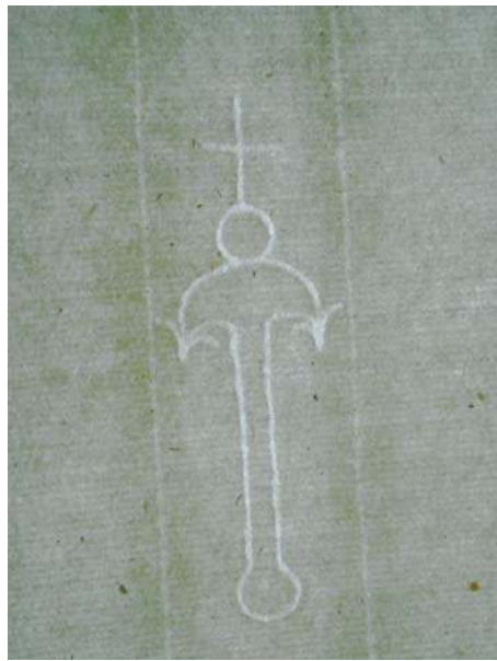
Figure 4: filigrane en forme d'ancre surmontée d'un globe terrestre et d'un crucifix sur papier Lombard. Cartulaire de Saint-Lazare de Falaise, fol. 106v (80 x 230 mm – 1487), Caen, Arch. dép. Calvados, 386 Edt 635.