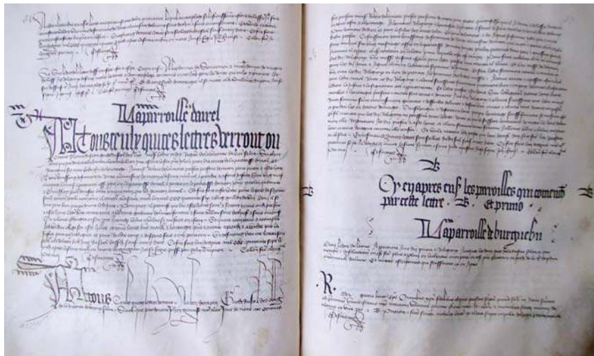
Figure 2 : cartulaire de Saint-Nicolas de Bayeux, p. 56-57 (1438), Bayeux, Bibl. mun., ms 1.