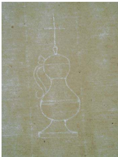
Figure 5: filigrane représentant un pot d'étain avec couvercle et anse surmonté d'une croix sur papier Lombard. Cartulaire de Saint-Lazare de Falaise, fol. 237v (77 x 25 mm - 1487), Caen, Arch. dép. Calvados, 386 Edt 635.