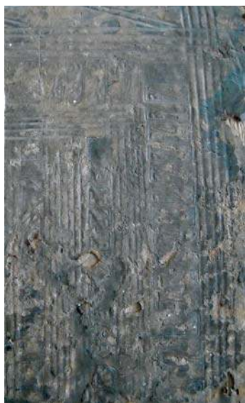
Figure 6: léopards estampés sur cuir - Couverture du cartulaire de N.-D. de Beaulieu de Caen, v. 1460 ?, Caen, Arch. dép. Calvados, Hnc 292 (cl. D. Jeanne).