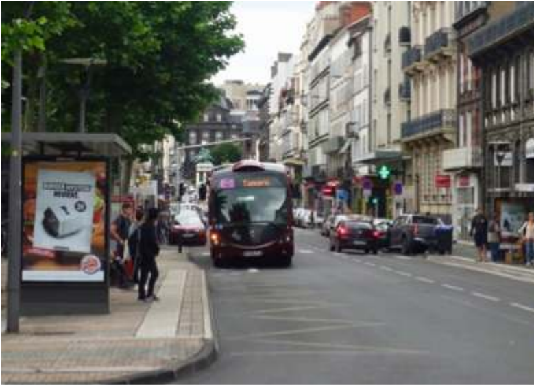
Clermont-Ferrand le 20/06/2019