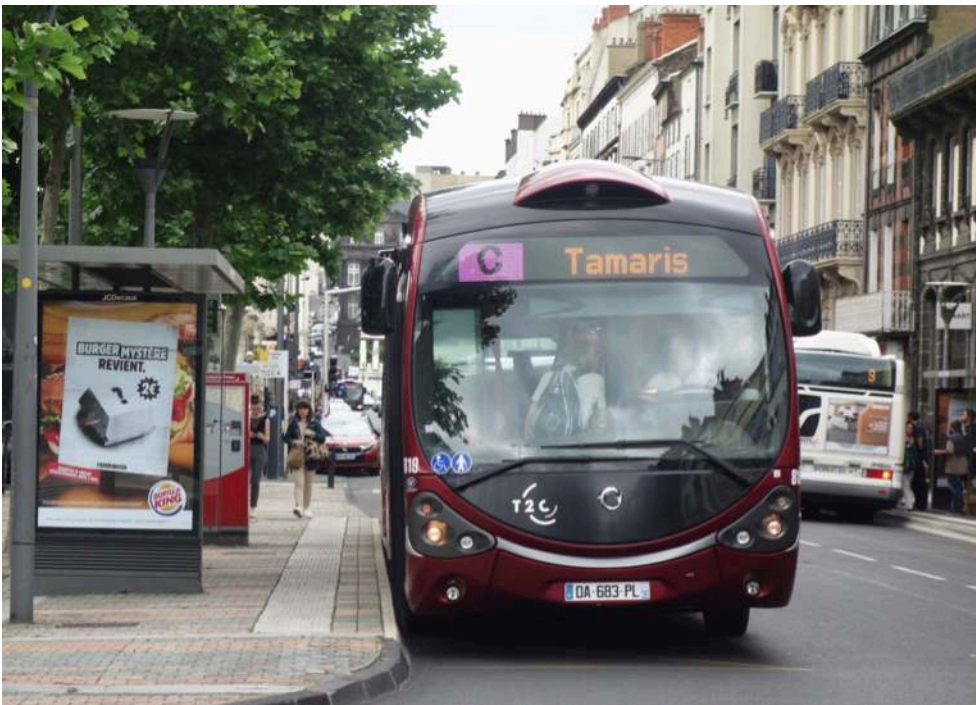
Clermont-Ferrand le 20/06/2019