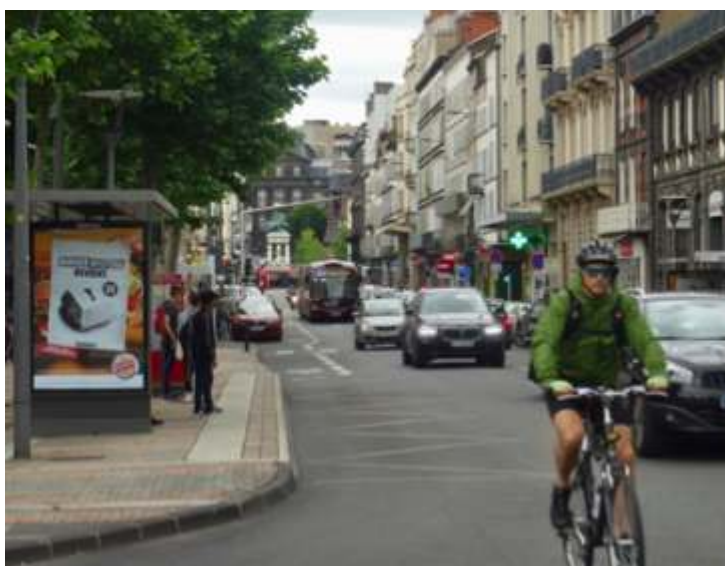
Clermont-Ferrand le 20/06/2019