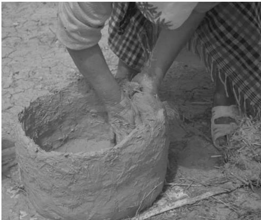
Photo 7. Élaboration d'un récipient cylindrique en argile à Kidiua Hainuna. Montage des parois du récipient