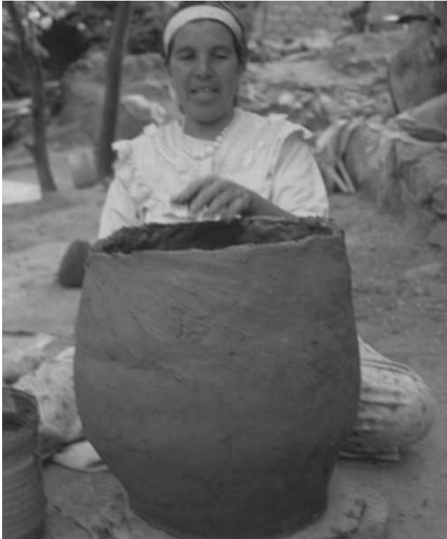
Photo 5. Élaboration d'un récipient cylindrique en bouse de vache mélangée avec l'argile à Ain Kob, selon la technique de Dar Hok