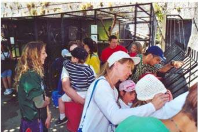
Les visites en famille sont une caractéristique majeure de la composition des publics de zoo. (ici à la Citadelle de Besançon).