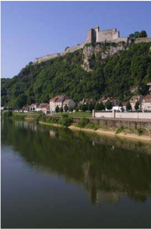
La Citadelle de Besançon.