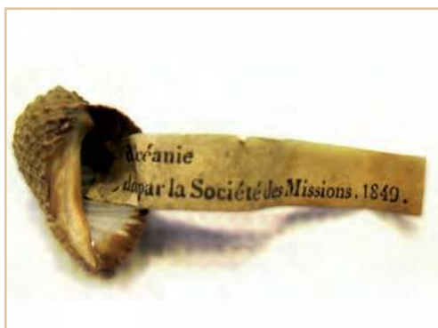
Coquillages collectés durant les expéditions en Océanie des années 1820-1840 et commercialisés par les marchands de curiosités pour collection dans la seconde partie du XIX e siècle. (Fig. 4a, b)