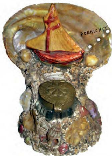
Encrier habillé de coquillages, souvenirs de Pornichet, village du sud de la Bretagne devenu station touristique bourgeoise avec l'ouverture d'une gare en 1879. Objet des années 1890-1900. (Fig. 6b)