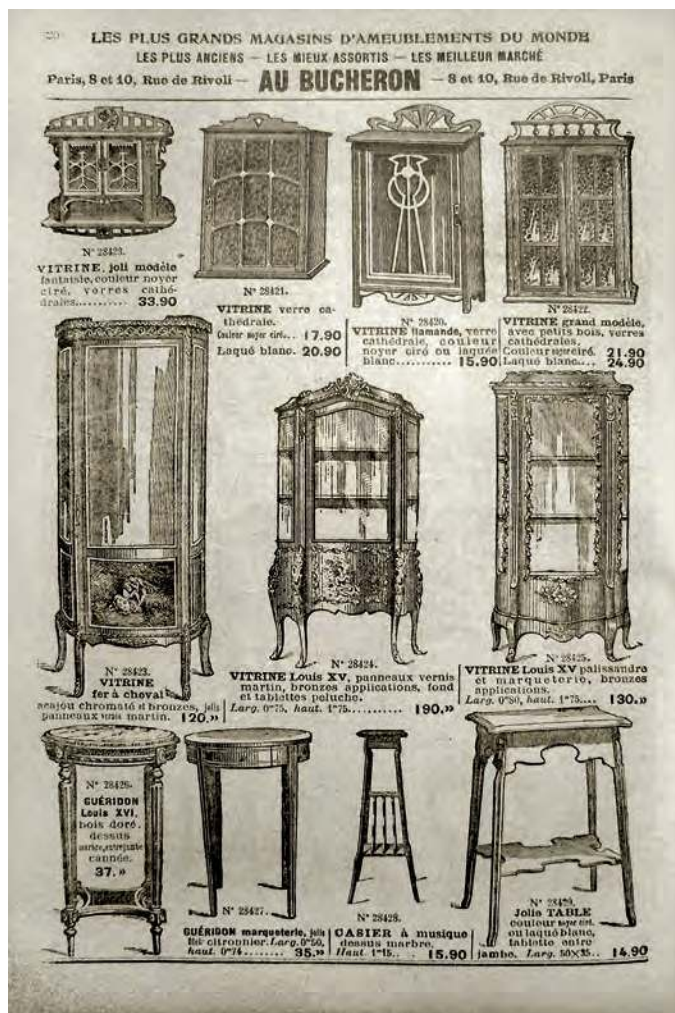
La vitrine - avec glaces et tablettes en verre ou recouvertes de velours - apparaît dans les années 1840 pour contenir, protéger et exhiber les collections qui se multiplient alors. Meubles vitrés pour collections dans le catalogue des grands magasins d'ameublement « Au Bucheron », rue de Rivoli à Paris, 1905. (Fig. 3)

Aux profondeurs terrestres qui nourrissent l'imaginaire de l'antédiluvien répondent les profondeurs marines. Les années 1850-1860 voient en effet surgir un nouveau meuble dans les intérieurs bourgeois, enfant des laboratoires et des muséums d'histoire naturelle : l'aquarium. Dérivé de la caisse de Ward, il se veut une récréation d'un écosystème plus ou moins équilibré qui permet la survie des poissons (Lorenzi 2009). Aux plantes nécessaires,