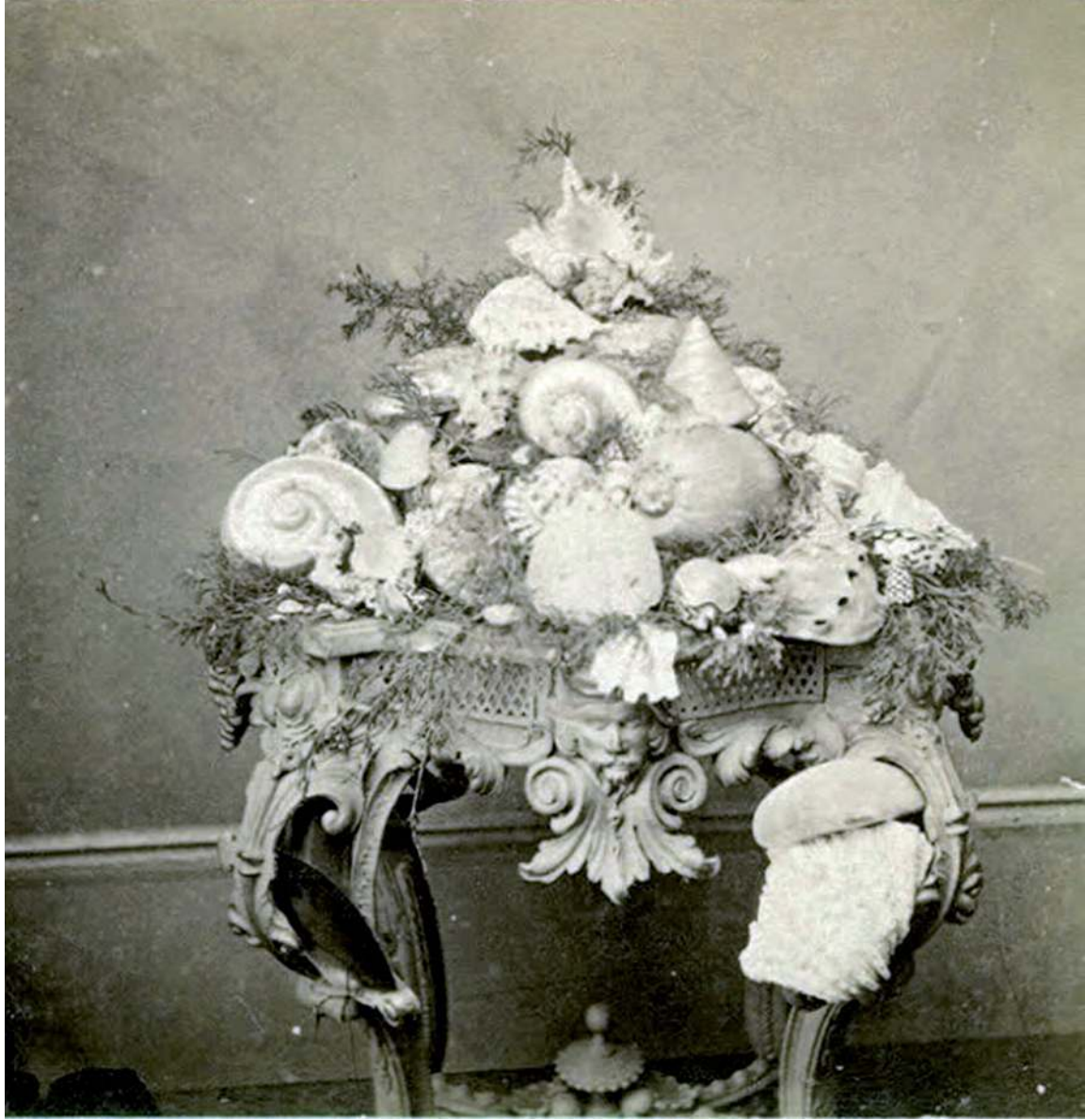
© Mrs. Shellhouse, Michigan, USA, vers 1870. Collection Manuel Charpy