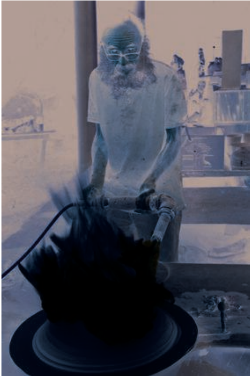
Céramiste en train de sécher une pièce en grés tournée à feu direct (cl. Angela Jiménez, 2014)