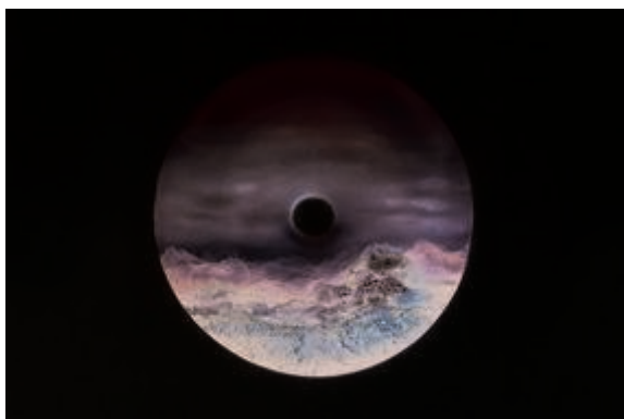
Jean Girel, Paysage Bourgogne , porcelaine, 2014. www.jeangirel.fr