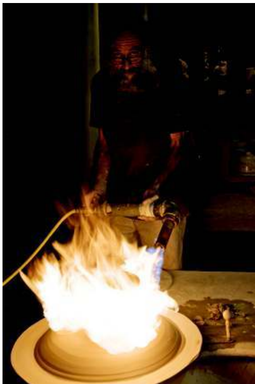
Céramiste en train de sécher une pièce en grés tournée à feu direct (cl. Angela Jiménez, 2014)