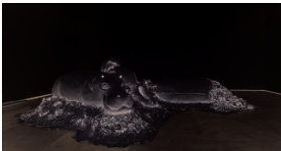
Daniel Dewar et Grégory Gicquel, Sans titre , kaolin, 2007. www.loevenbruck.com (cl. Galerie Loevenbruck, Paris, 2015)