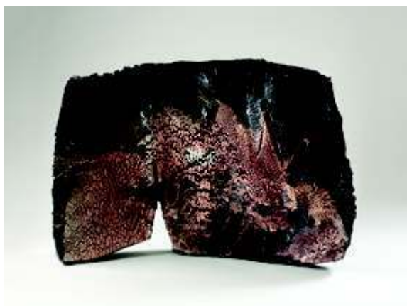
Claude Champy, Falaise , grès, 2019