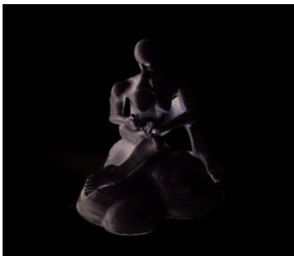
Louise Hindsgavl, Feeling love , 2006. www.louisehindsgavl.dk