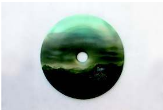
Jean Girel, Paysage Bourgogne , porcelaine, 2014. www.jeangirel.fr