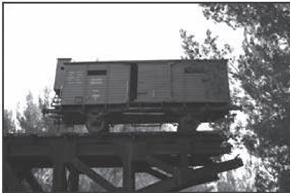
Figure 2 : Mémorial pour les Déportés

montre que le wagon symbolise à la fois la déportation et l'émigration, la destruction et la renaissance, Auschwitz et Jérusalem.