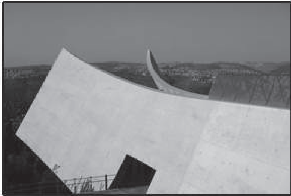
Figure 1 : Le nouveau musée d'histoire de la Shoah : un prisme qui s'ouvre sur les collines de Jérusalem