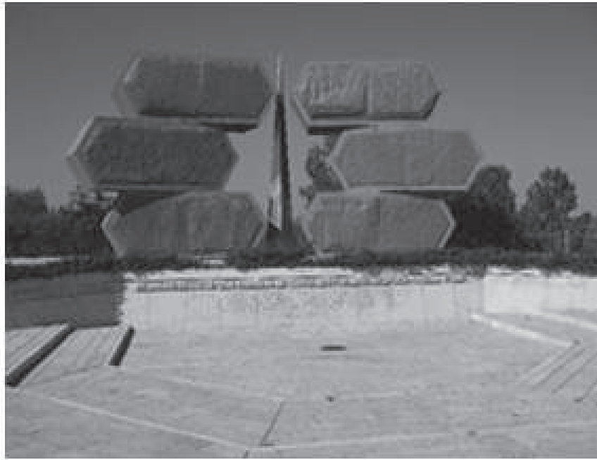
Figure 4 : Mémorial des soldats et partisans juifs, conçu par Bernie Fink