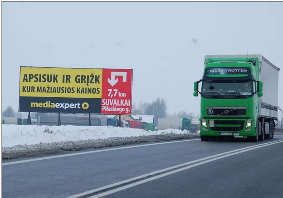
Photo 1 : Publicité sur la route frontalière entre Pologne et Lituanie : « Fais demi-tour et reviens là où les prix sont les plus bas »