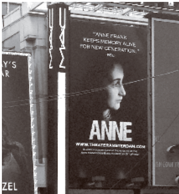
– Affiche de la nouvelle pièce ANNE à Times Square, New York.