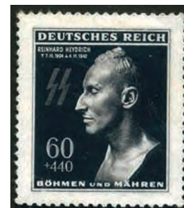
– Reinhard Heydrich, timbre émis après l'attentat de la Résistance tchèque qui lui coûta la vie

Au sein de l'Hauptabteilung II, Unterabteilung III, il a pour tâche de combattre les communistes, le mouvement syndical et divers autres groupes d'opposants,